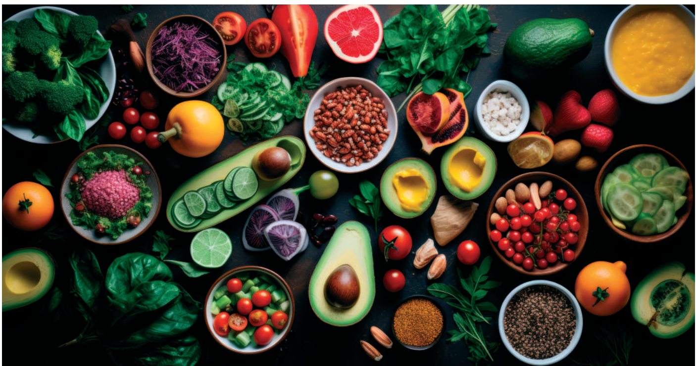
A Teremtő a mi disznótermék-alapú táplálkozásunk helyett a növényi élelmek csodálatos gazdagságát kínálja fel nekünk

Figyelembe véve a korai életszakaszban kialakult betegségek robbanásszerű terjedését, a szakemberek egyre nagyobb hangsúlyt helyeznek a megelőzésre. Már gyerekkortól javasolják bizonyos étrendi szabályok bevezetését. Ne feledjük, hogy az ízlés alakítható, és a gyermekkorban meghozott helyes táplálkozással kapcsolatos döntések pedig egy kiegyensúlyozott élelmiszeri magatartást fognak eredményezni.