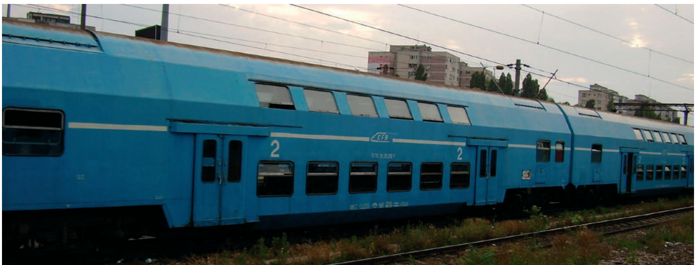
A nemrég elmúlt korszak emeletes vagonjai

Egy szombaton gyerekeimmel Bánffyhunyadra indultunk, gyülekezetbe. Visszajövet egy emeletes vagonból álló szerelvényvel utaztunk. Téli, hideg idő volt, és már