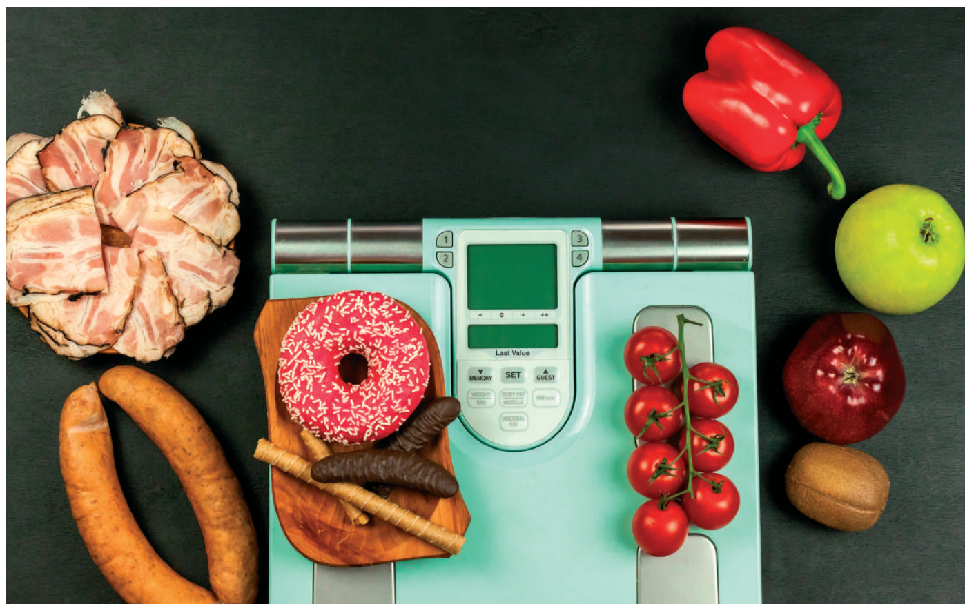
A bölcs ember kérni fogja Istentől: segítse meg mindig a jó döntéseket meghozni

ki az agynak a kívánság érzetért felelős központját).