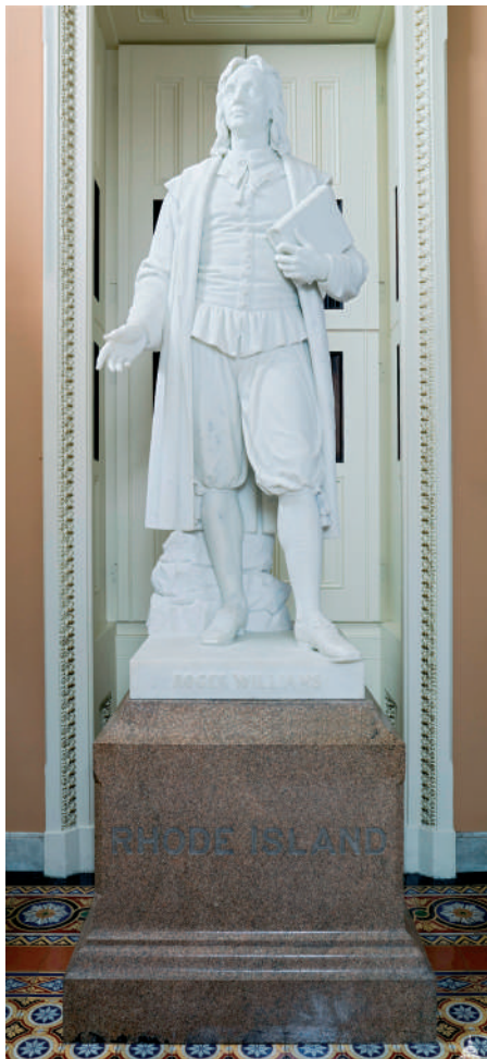
Roger Williams-t ábrázoló márványszobor a washingtoni Kapitólumban. Franklin B. Simmons (1839–1913) alkotása, 1872

A Bibliát tartották a hit alapjának, a bölcsesség forrásának és a szabadság alapszabályának. Elveit szorgalmasan tanították a családban, az iskolában és a gyülekezetben. Ennek a gyümölcsei a takarékoságban, az értelmességben, a tisztaságban és a mértékletességben mutatkoztak meg.