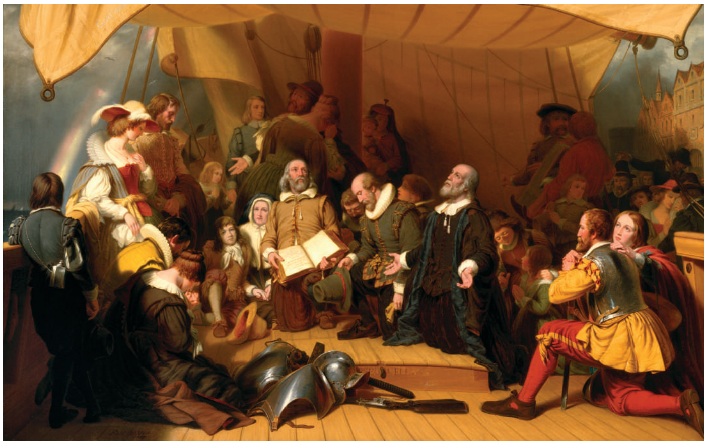
A puritán zarándokok hajóra szállnak Európában. Robert Walter Weir (1803–1889) festménye

üldözöttek semmi jelét nem látták annak, hogy sorsuk később javulni fog. Sokan arra a meggyőződésre jutottak, hogy azoknak, akik Istent lelkiismeretük parancsa szerint akarják szolgálni, „Anglia örökre megszűnik lakható hely lenni”. 2 Egyesek elhatározták, hogy Hollandiában keresnek menedéket. Nehézségeket, veszteségeket, rabságot szenvedtek. Szándékaikat megghiúsították. Ellenségeik kezére játszották őket. De a rendíthetetlen kitartás végül győzött, és az üldözöttek menedéket találtak a Holland Köztársaság barátságos partjain.