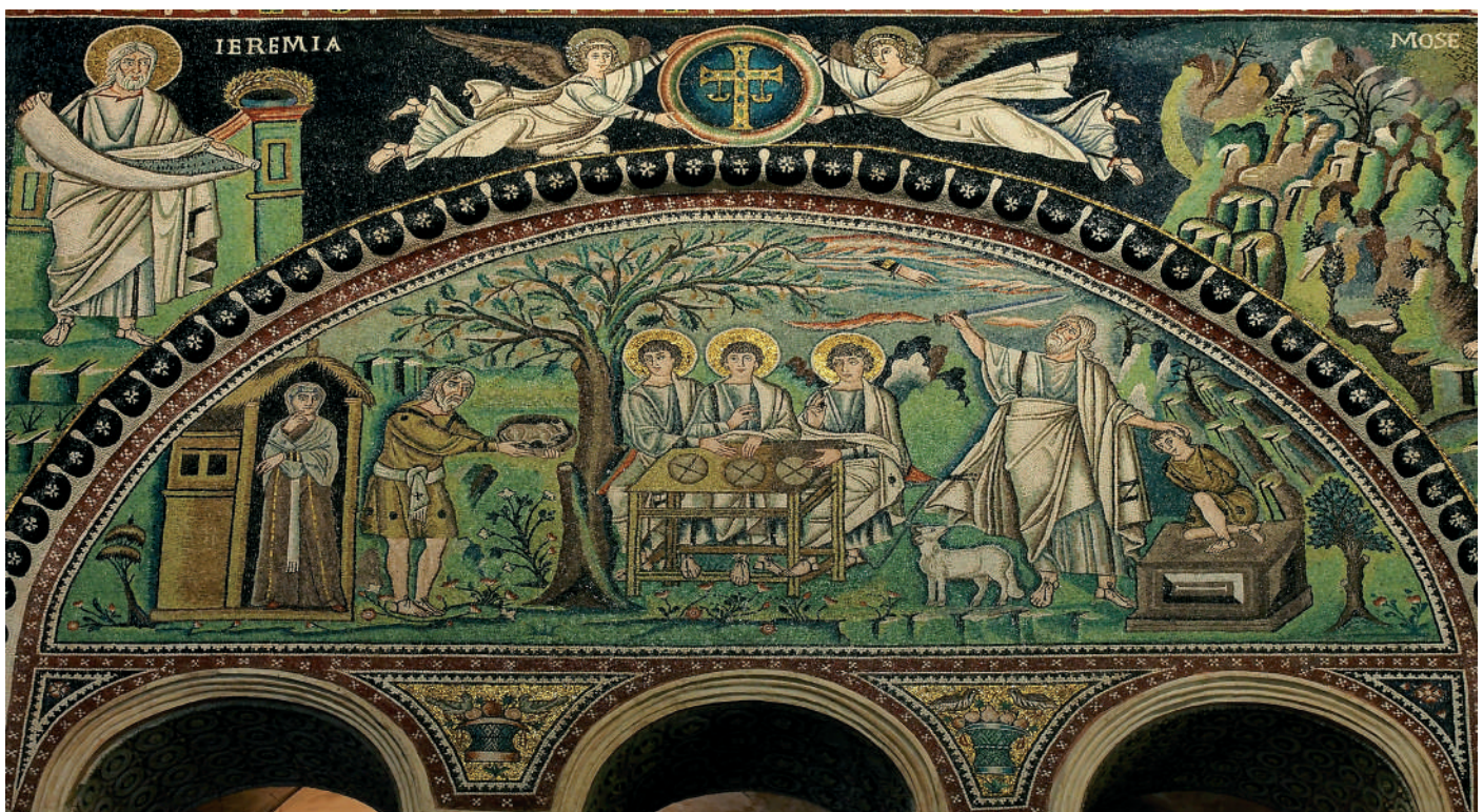
Ábrahám megvendégeli a három idegent; Izsák oltárra helyezése. Mozaik a ravennai San Vitale bazilikából