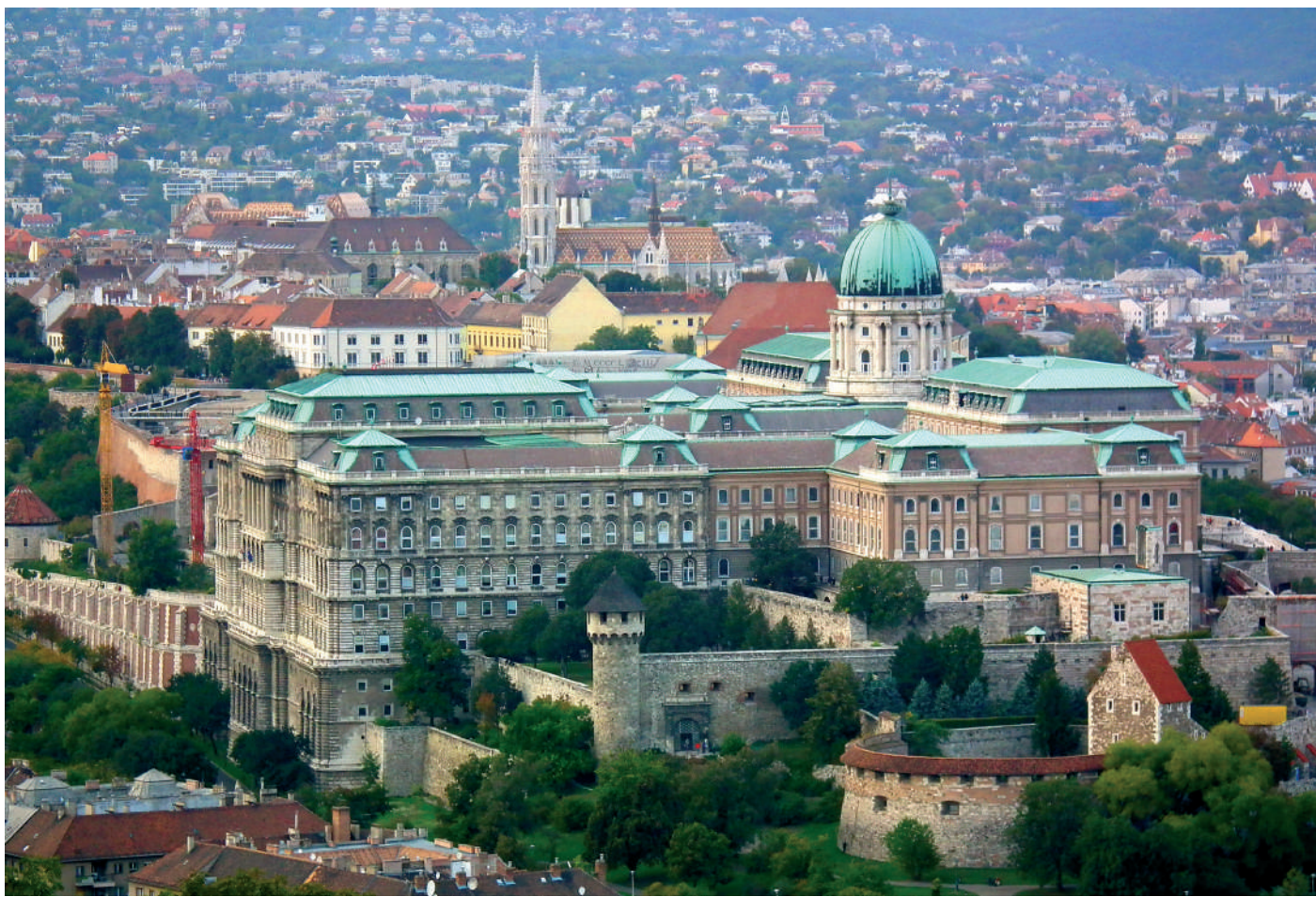
A Budavári Palota napjainkban, a Budai Várnegyedben

A magyar királyság a hatalmas károk ellenére nagyon hamar magához tért. Béla már 1243-ban megalapított és építeni kezdett a mai, jól védhető Várhegyen egy királyi kővárat, mely köré azután lakóházak és kőfal épültek. Ide települtek az elpusztított Pest lakosai. Ez lett a ma is ismert Budavár – az eredeti Buda városa, az első királyi várral a Duna jobb partján levő síkon, a mai Óbuda Főtere körül volt, ám ez a tatárjáráskor nagy károkat szenvedett.