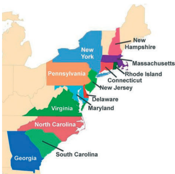
A Nagy-Britanniától való függetlenséget 1776-ban kikiáltó tizenhárom amerikai gyarmat

Ellen Gould White (1827–1915) Maine államban született, methodista családban, puritán tradíciójú környezetben. Tizenkét éves korában adta át életét Istennek egy methodista tábortalálkozón. 1846-ban ment férjhez James White prédikátorhoz, és négy fiuk született. 1845-től kezdve férjével együtt alapítói voltak az akkor megszülető adventista egyháznak. Ellen egy életen át sokat írt, utazott, sőt, prédikált. Részt vett szanatóriumok, kollégiumok, kiadóhivatalok alapításában, s a növekedésnek indult egyházuk megszervezésében. A nagy küzdelem című munkája 1888-ban jelent meg, majd 1911-ben egy átdolgozott, végső változatát pub-