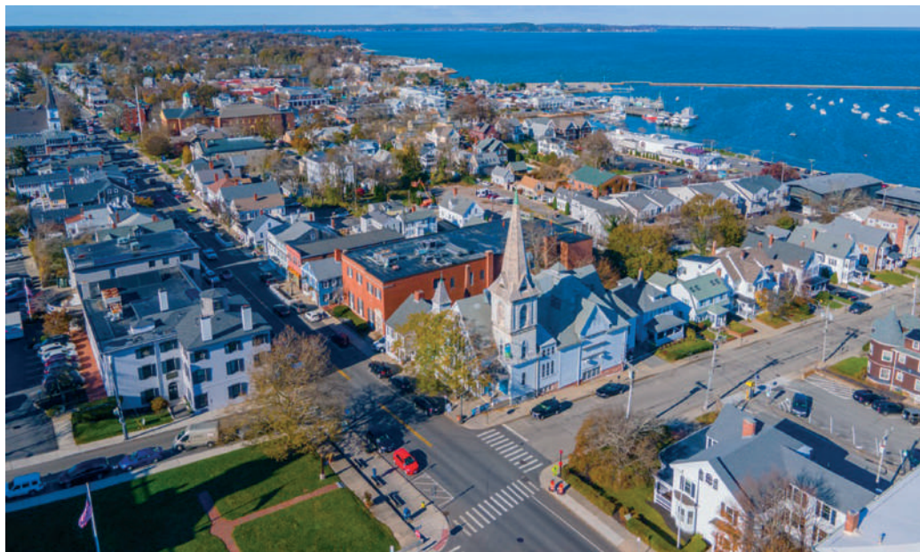
Ahol az első puritán telep megalakult: Plymouth városa ma. Jelenlegi lakossága 61 ezer

1880-ra a tagok száma 16 ezerre nőtt, s ezután indult meg a világszerte missziómunka is. 1901-re már 75 ezer tagjuk volt, majd 1945-re ez a