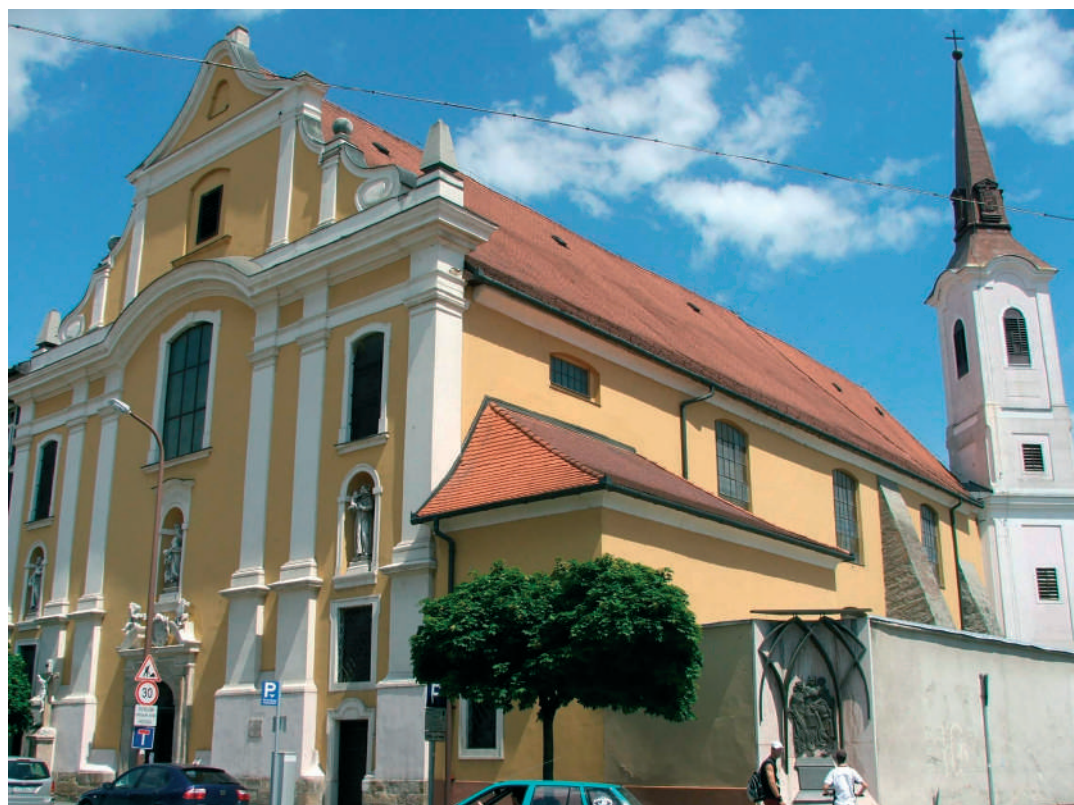
Az esztergomi ferences templom. Az eredeti templom 1224-ben épült, ám a török hódoltság idején elpusztult. Ebbe temetkezett IV. Béla és családja – ám a sír pontos helye nem ismert. A mai templom a 18. század első felében készült

Érdekes módon, ezt követően a két király kiegyezésre törekedett. A következő évi bécsi békében megállapodtak abban, hogy Béla a csehek királyához adja – persze, a pápa engedélyével – Margit nevű lányát, aki akkoriban már 19 éves volt, de a Nyulak-szigetén (a későbbi Margit-szigeten) levő zárdában még 12 évesen letette a szerzetesi fogadalmat. Margit Klissza szigetén született meg 1242. január 27-én, a legnagyobb tatár veszedelem közepette, és a menekülő királyi pár, kétségbeesett helyzetében ekkor ajánlotta őt fel Istennek. Margit azonban nem fogadta el az ajánlatot, és apácaként halt meg 1270-ben, 28 évesen. Szentté avatásáról XII. Piusz pápa döntött, 1943-ban. Ma így emlékszünk rá: Árpádházi Szent Margit.