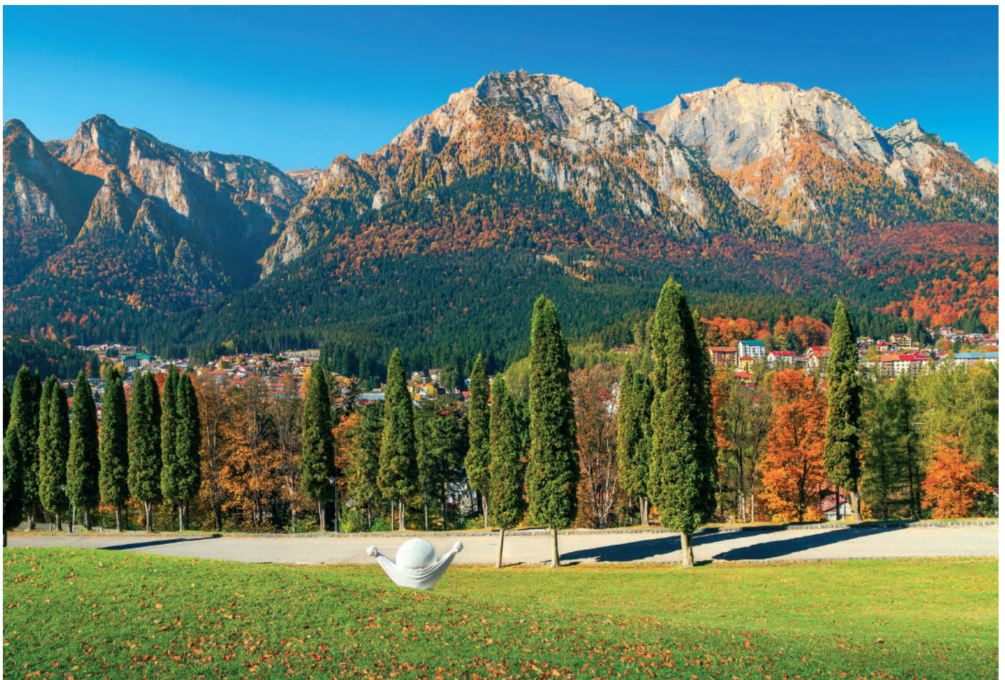
A Prahova-folyó lenyűgöző völgye, háttérben a Bucsecs-hegység hatalmas sziklaszirtjeivel

A '80-as években történt, hogy befizetett egy leningrádi kirán-