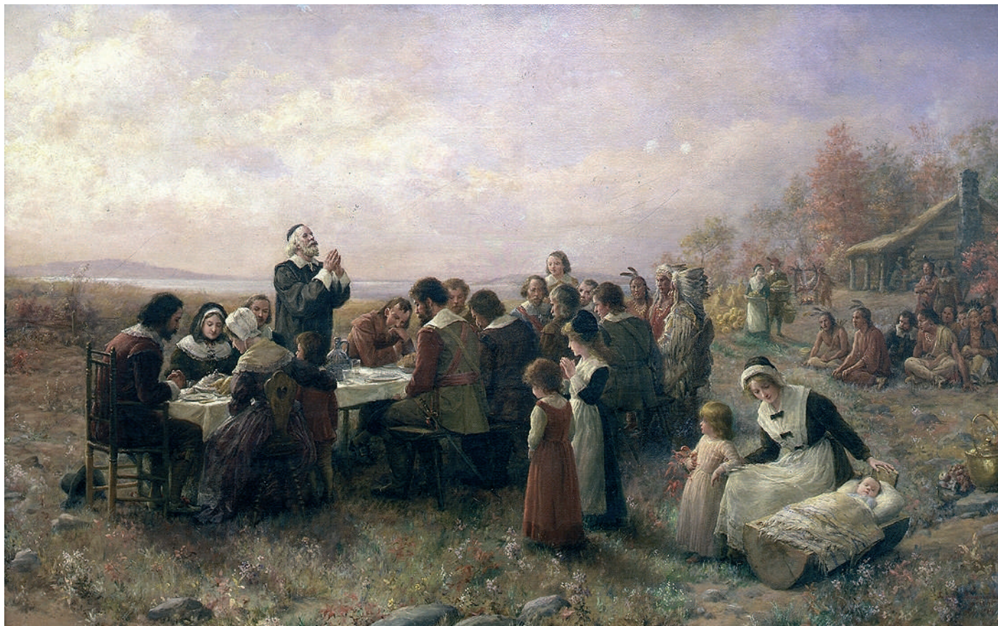
Az első Hálaadási-ünnep Plymouth-ben. Jennie Augusta Brownscombe (1850–1935) festménye, 1914