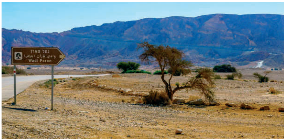
Az Izmaélnak és Hágárnak menedéket nyújtó Párán pusztájának pontos helyét még vitatják. A képen a ma Wadi Paran-nak nevezett völgy látható a Negev-sivatagban

Elérve az Isten által megjelölt hegyhez, a szolgálakat hátrahagyják, és csak ketten haladnak felfelé arra a hegyre, amit ma Sionként ismerünk – ahova később a templom épült, és ahol az Úr Jézus keresztre is felállított. Az édesapja által gyakorolt áldozati törvényeket jól ismerő Izsák furcsának tartja, hogy csak a tűzifa, a kés, meg a paraszas korsó van náluk – de hol az áldozati bárány? Íme, Ábrahám válasza: