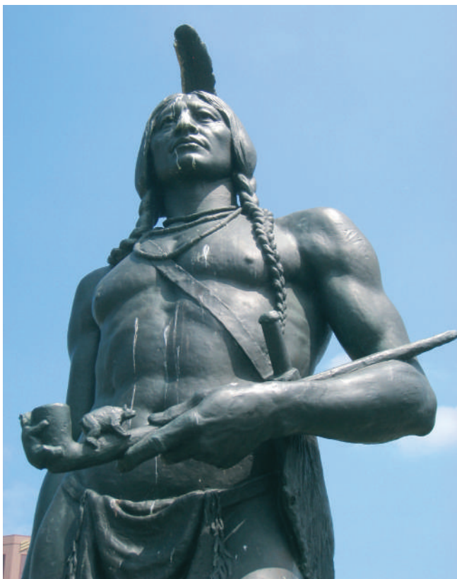
Aki a zarándokok letelepedését lehetővé tette: Massasoit (1581–1661), eredeti nevén Ousamequin, a Wampanoag törzsszövetség főnöke. Cyrus E. Dallin (1861–1944) szobra Kansas City-ben

Hónapokig tartó hányódás és bolyongás után végül a Narragansett öböl partjai felé vette útját, és ott lerakta az újkor első olyan államának az alapját,