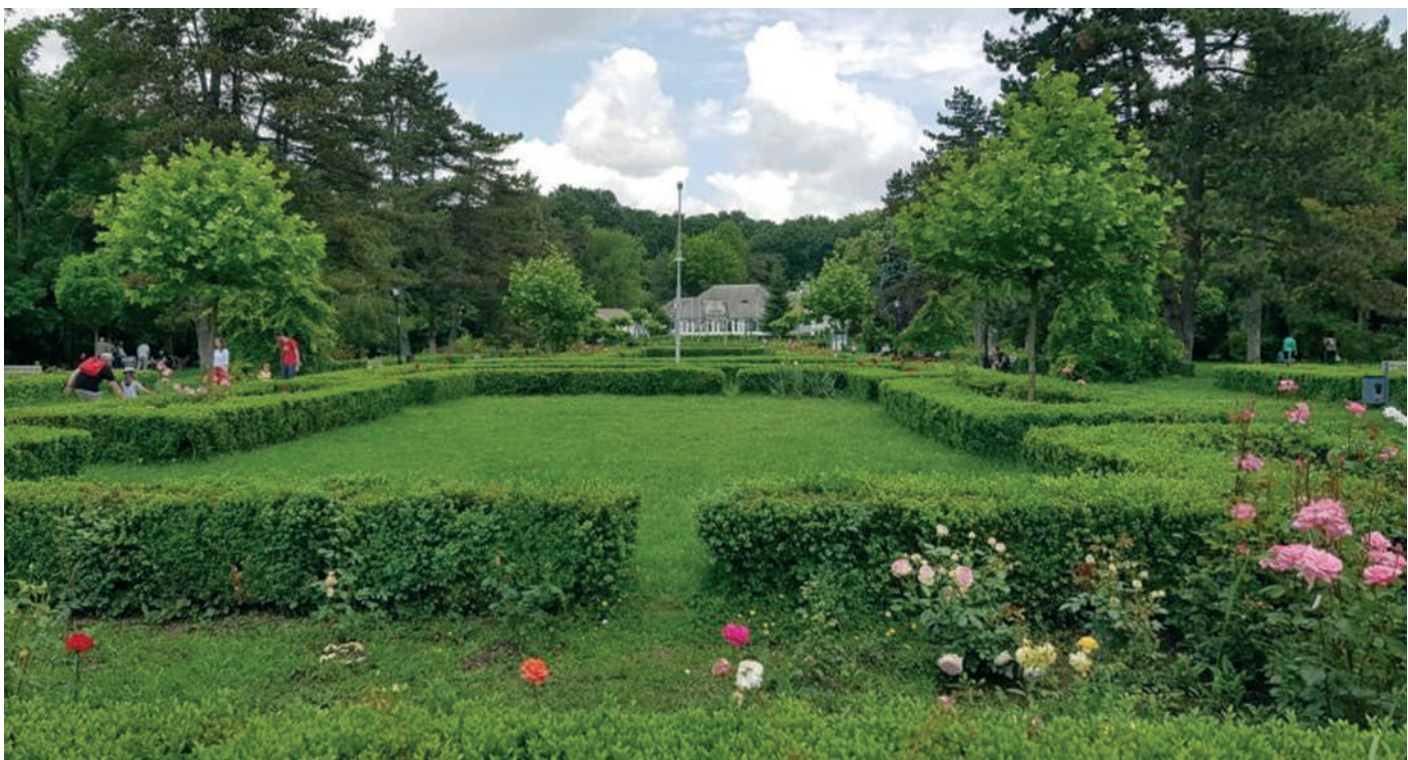
A Băneasa-erdő csodálatos, parkszerű benyílója, háttérben a Fehér Ház vendéglővel