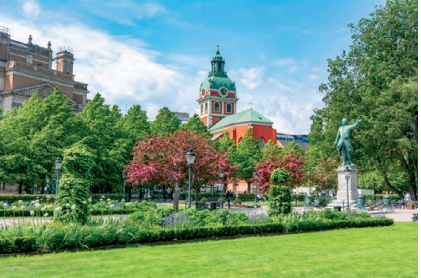
A Stockholm központjában levő, XII. Károly tér (Karl XII: torg), háttérben a 16. századi Szent Jakab templommal (Sankt Jakobs kyrka). A téren XII. Károly (1682–1718) 1868-ban felállított bronzszobra látható

húzni a padról. A férjemre néztem, és láttam, hogy az ő kezét is megfogja, és húzza valaki!