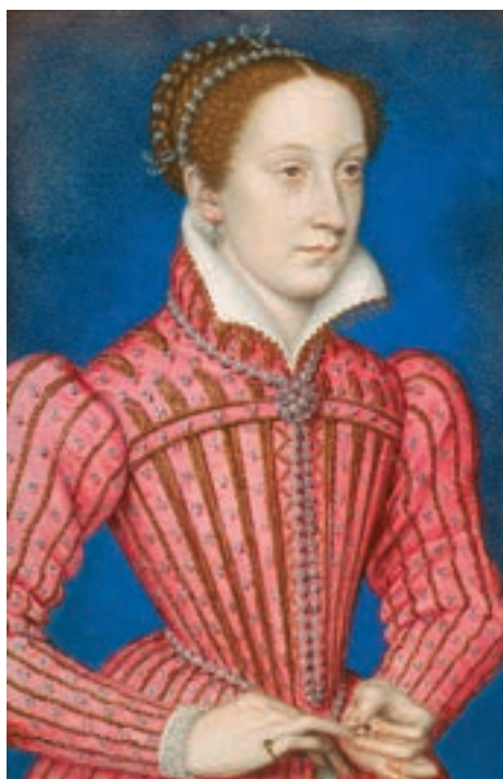
Stuart Mária tizenhét évesen, franciaországi tartózkodása idején. Francois Clouet (1510–1572) festménye

Ekkor is, miként az apostoli időkben, az üldözés előmozdította az evangélium terjedését. Abban az undorító börtönben, amely erkölcstelen és gonosztevő emberekkel volt tele, John Bunyan (1628–1688) , egy egyszerű üstfoltozóból let puritán prédí-