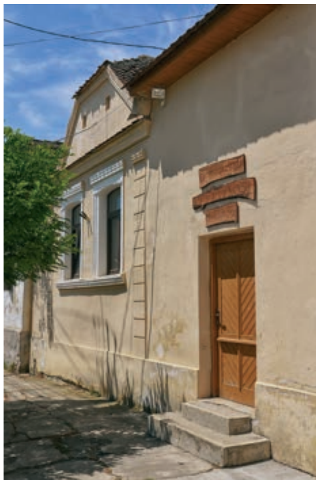
Apáczai emlékház Apácán