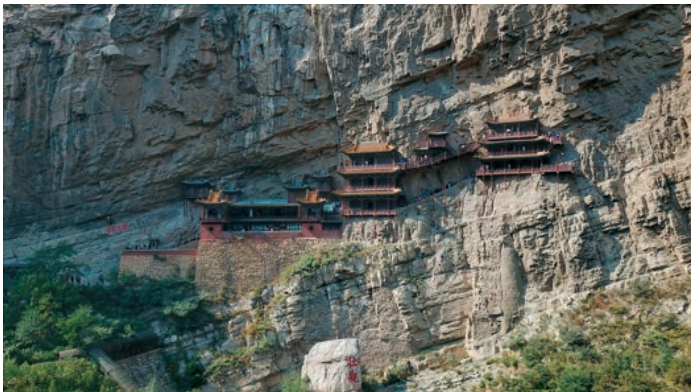
A Fügő Kolostortemplom, Shanxi tartományban. E templomban egyedülállóan ötvözik a kínai buddhizmus, a konfucianizmus és a taoizmus hagyományait és filozófiáját

Konfuciusz ekkor csalódottságában önkéntes száműzetésbe vonult tanítványaival együtt. Tizenhárom éven át szüntelenül vándorolt abban a reményben, hogy elméleti ismereteit újból az államigazgatás szolgálatába állíthatja, de ez többé nem vált valóra. Hazatérésekor tisztelettel fogadták, de kormányzási ügyeket már nem bíztak rá, így élete végéig irodalmi tevékenységet folytatott. Jelleméről csak jó dolgokat említenek. Szerény volt, keveset evett, és az ivást sem vitte túlzásba, másrészt elítélte a tiszteletlen úton szerzett gazdagságot.