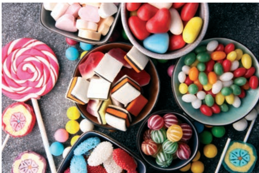
Az egészségtelen édességek az Alzheimer-kór okozói is