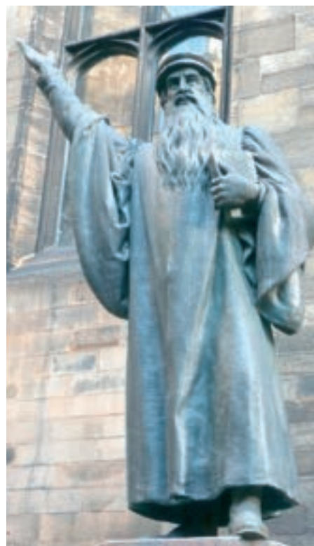
John Knox szobra Edinburgh-ben

John Knox (gaelül, vagyis skóttul Iain Cnocc, 1514–1572), aki kezdetben jegyző volt, fokozatosan elfordult az egyház hagyományaitól és miszticizmusától, hogy Isten Igéjének igazságaiból táplálkozzék. George Wishart tanítása megerősítette abban az elhatározásában, hogy elhagyja a római egyházat, és az üldözött reformátorok mellé áll. Nem sokkal azután, hogy a megreformált hitet elfogadta, megtagadta a szentek, képek, szobrok tiszteletét, a halottakért mondott imákat, a purgatórium tanát, és egyedül a Bibliát tekintette a hit alapjának. John Knox félté Istent, de nem félt az emberektől. Sőt, az üldözések, meg a körülöt-