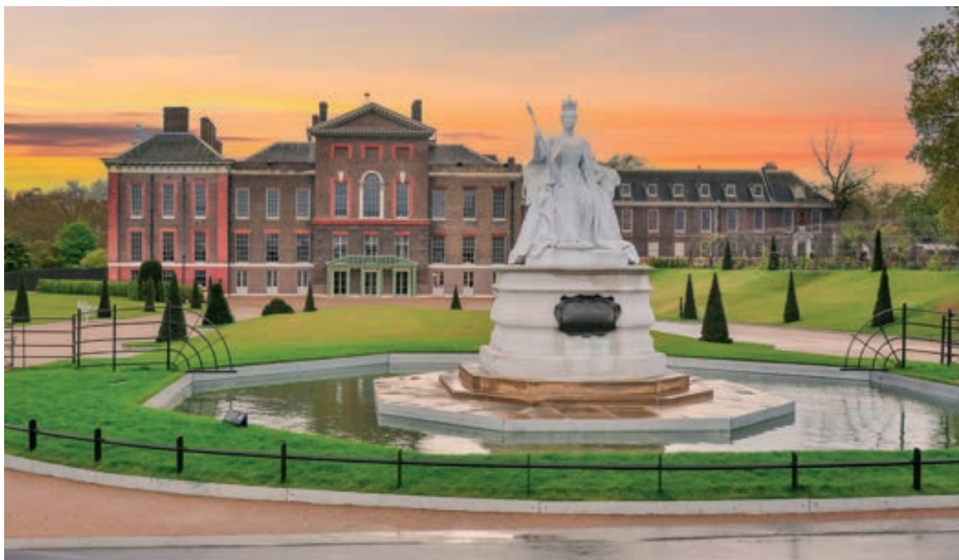
Viktória királynő szobra a Kensington palota előtt

dobtak, hadd higgyék a többiek, hogy pénzérme volt az. Egy nagy halom lett az értéktelen kacatból!