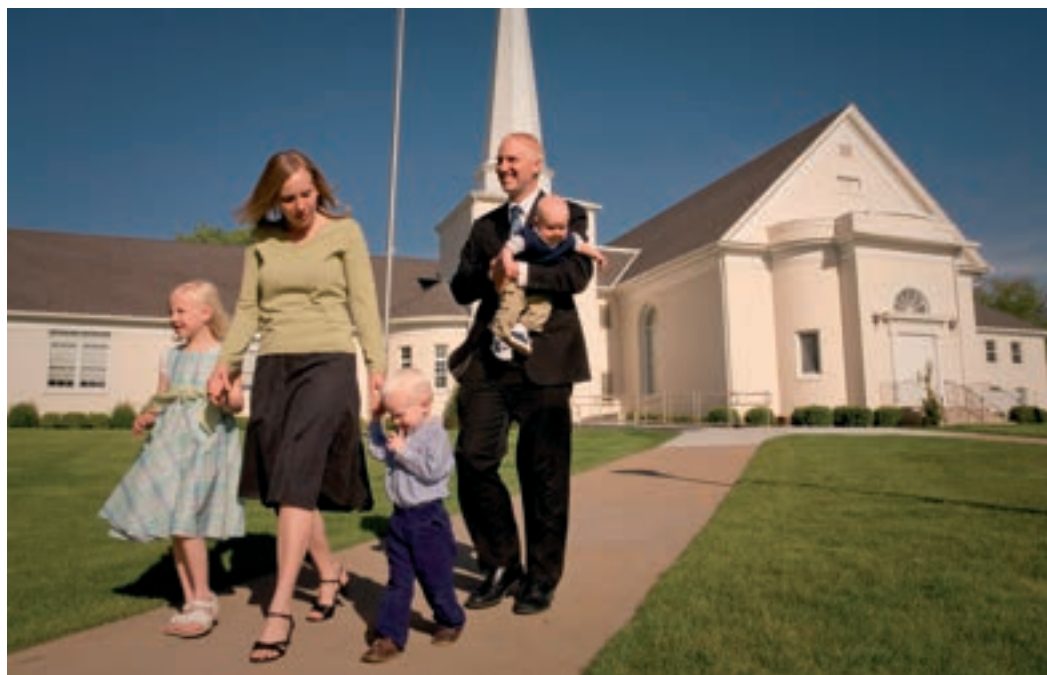
Jézus azt szeretné, ha családjából senki sem hiányozna az Ő országából!

Az ezer év szeretet-uralma alatt, mintegy videóban kivetítve, Isten bemutatja egyrészt a bukott angyalok eseteit, másrészt mindazon emberek életét – cselekedését, szavát, gondolatait –, Kaintól kezdve, akik a Bárány vérét elutasítva, nem örökölték a mennyei Kánaánt.