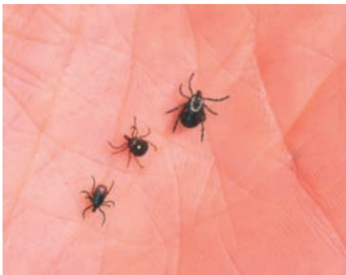
A kullancsfertőzés Lyme-kórt, ez pedig a maga során Alzheimer-kórt okozhat

amelynek atrófiás hatása is van a temporális (halántéki) és parietális (falcsonti) homloklebeny kéregállományára.