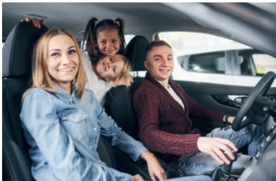
Ki vagy mi fontosabb számunkra: a szeretteink, vagy a tárgyaink?

Határozott kézírással a következő szavak álltak rajta: