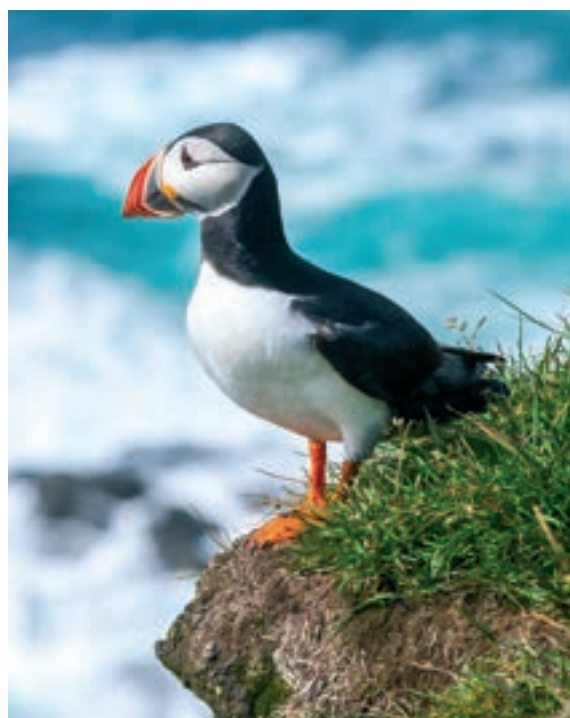
Egy másik színpompás lény a lunda: az Atlanti-óceán északi részén (Grönlandon, Észak-Kanadában, Izlandon, Faröeren, stb.) fészkel, de telelni délebbre, egészen Afrikáig is lehúzódhat

Az óra szerkezetét egy órásmester gondolta ki és készítette el.