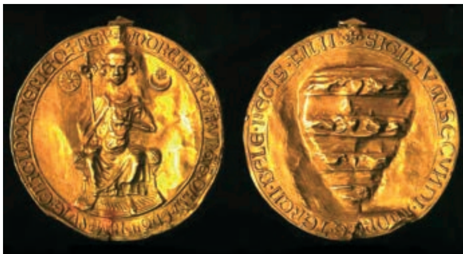
Az Aranybulla pecsétjének két oldala

leszögezték, hogy a megszolgált birtokokat a király nem kobozhatta el, tulajdonosaik szabadon rendelkezhetek velük, adományozhatták, örökíthették, s csupán a nemzetség kihalásával szálltak vissza az uralkodóra.