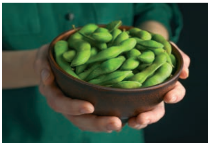
Edamame – szója zöldbab

Elhangzott az a vélemény is, hogy az ázsiaiak genetikailag védettek a rák ellen, csak hogy ugyanezek az emberek nyugatra kivándorolva lassan ugyanazokhoz az előfordulási arányokhoz igazodnak, mint a befogadó ország lakói. Úgy vélik, hogy ez a jelenség a nyugati étrend átvételének és a szójabevitel csökkentésének a következménye. Ha a japánok Hawaiira vándor-