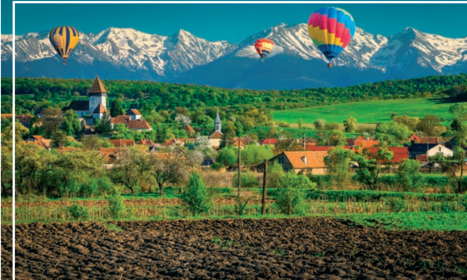
SZÁSZFÖLDI TÁJ, HÁTTÉRBE A FOGARASI-HAVASOKKAL