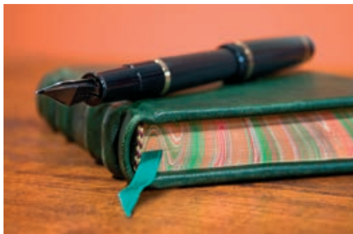
Segíthet az, ha a rákos beteg naplót vezet tapasztalatairól, érzéseiről

újrértékelődésnek vagy újjászületésnek a folyamatában.