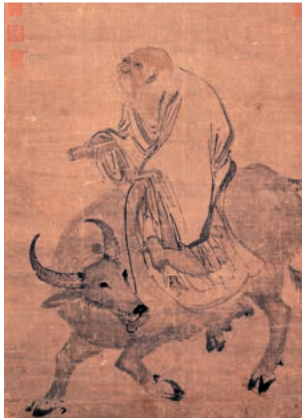
Ősi festmény a bivalyon lovagoló Lao-ce-ről

arra, hogy behatoljon a természet folyamatába, uralkodjék a szellemeken, megszelídítse az állatokat, jósoljon és csodákat tegyen. A taoizmus az idők során valássá alakult, amelynek felépi-