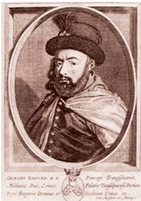
II. Rákóczi György