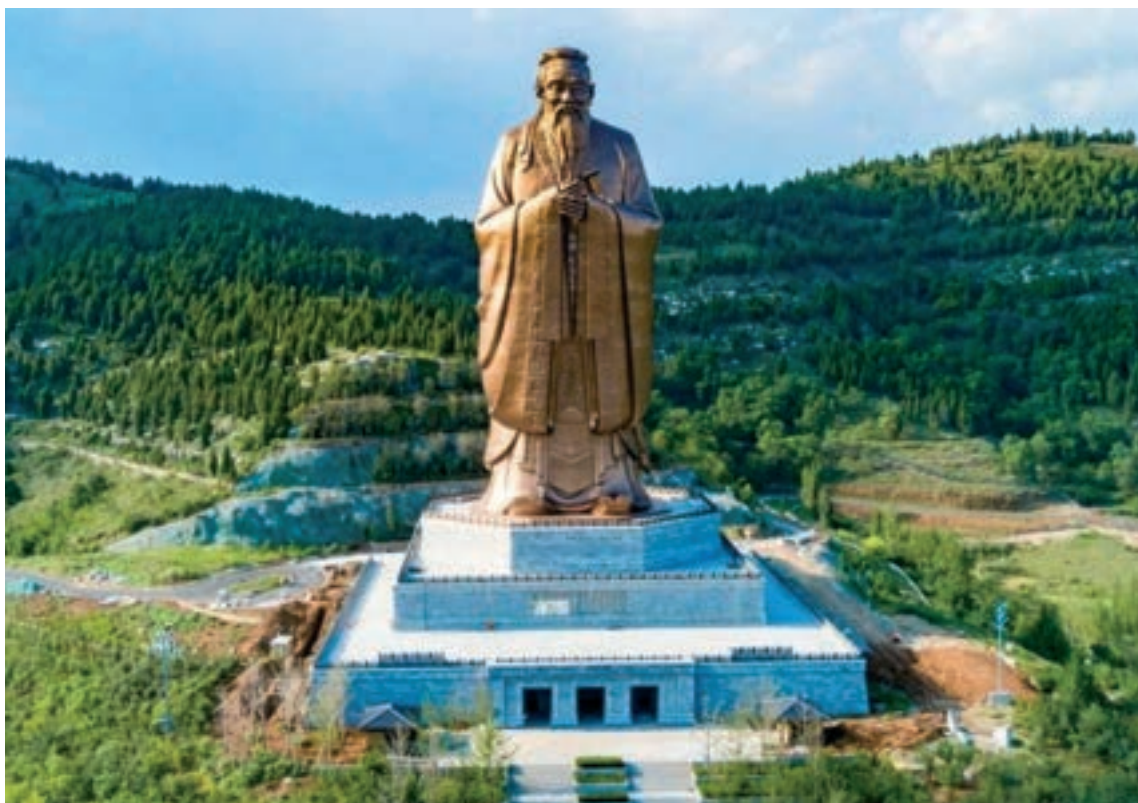
2018-ban avatták fel Shandong tartományban Konfucius 72 méter magas bronzszobrát

Lie-ce, a taoizmus egyik legfontosabb szerzője azt állította ma-