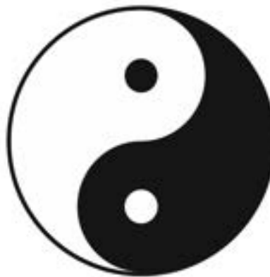
A két univerzális erő, a jin és a jang szimbóluma

A régi kínai világszemlélet szerint valójában nem létezik különbség élő és élettelen, személy és tárgy között, ezért e témát tanulmányozva a T’ien a mi szemünkkel nézve hol istennek, hol tárgynak, hol jelenségnek tűnik. Ezért van az, hogy különböző korszakok gondolkodóitól egymástól eltérő magyarázatot kaptunk. Mindegyik