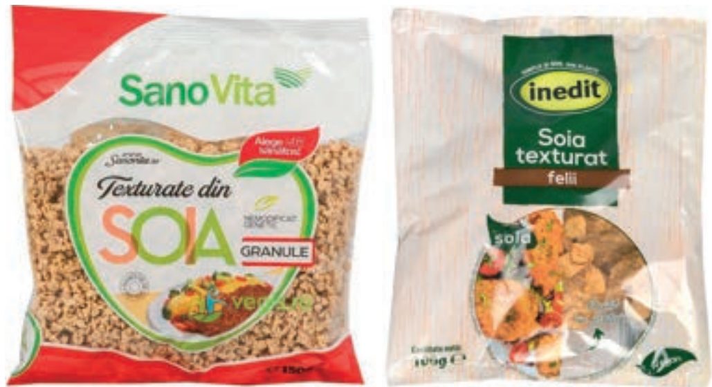
Szójaszelet és granulátum

5. Végül pedig, egyetlen utalást sem találunk arra vonatko-