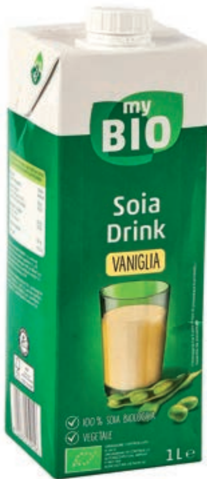
Penny üzletláncban kapható szójatej

A szaponinok bonyolult, nagy molekulájú glikozid vegyületek. Nevük a latin sapo („szappan”) szóból ered, mivel vízzel összerázva erősen habzanak. A szaponinok számos növényben megtalálhatók, pl. édesgyökér, orvosi szappanfűgyökér, kan-