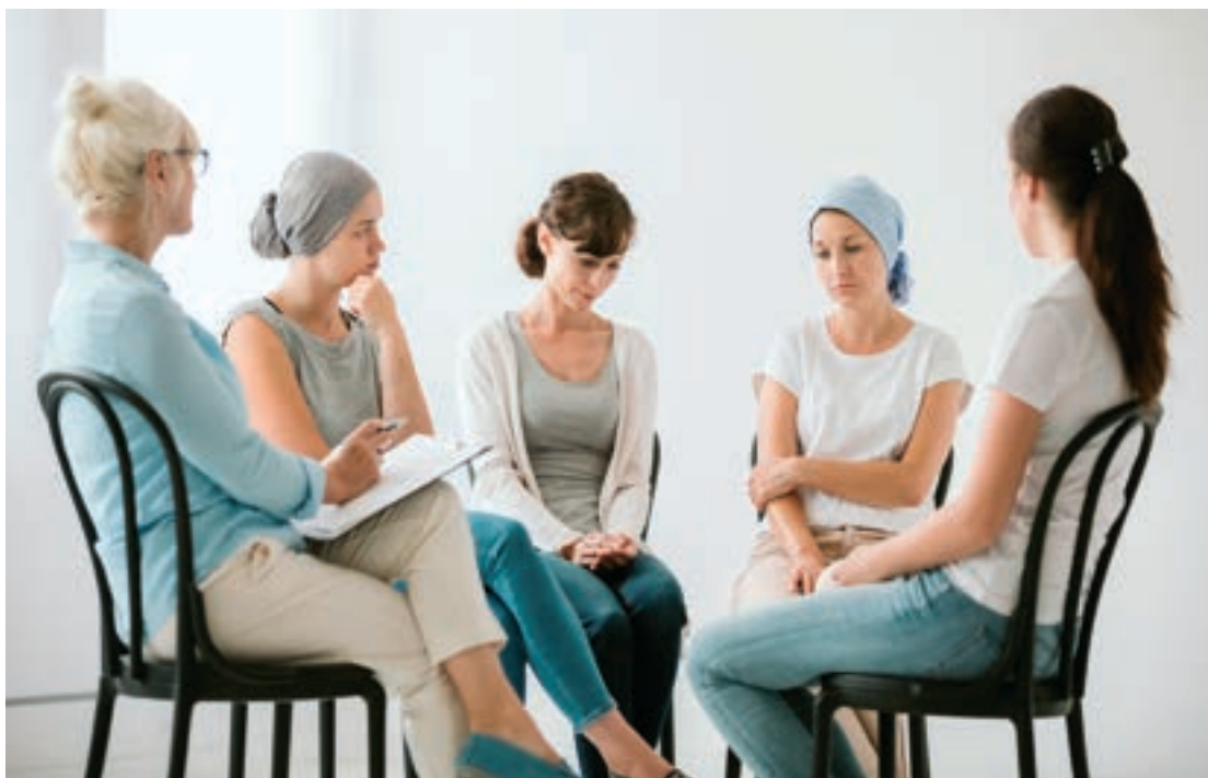
Nagyon fontos a környezet együttérző magatartása. Beszélgető, támogató csoport

A napló segítségével ugyanakkor nagyon hatékonyan kiértékelhető és nyomon követhető a személyes fejlődés, a testi erő visszanyerése, a célok átértékelése vagy a küzdelem felvállalása tekintetében. Az élet bizonyos értelemben egy mozgásban levő folyamat. Amikor lehetőségünk van kiértékelni a nehéz életszakaszokban elért fejlődés mértékét, akkor az előbbre jutás jóleső érzése tölt el. Visszatekintve, hogy milyen voltál az út elején a diagnózis pillanatában átélt érzéseiddel, és megállapítva, hová jutottál mindenféle beavatkozás után, talpon vagy és sokkal erősebben – a hála, az erő, a kiegyensúlyozottság érzése tölthet be ebben a személyes