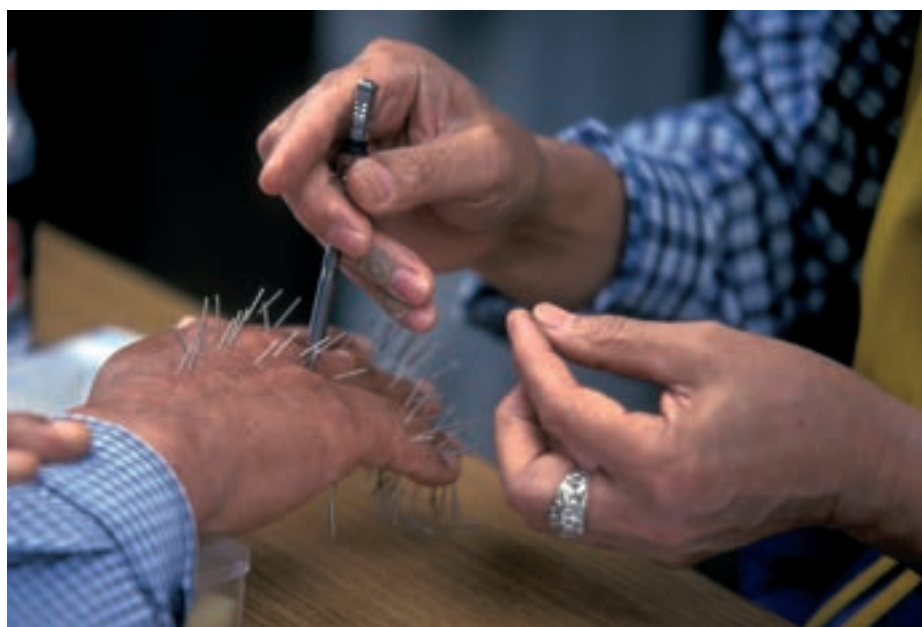
A taoista energiaelméletre köthető az ősi kínai gyógyászat, az akupunktúra is. Akupunktúrázás kezelés Dél-Koreában

A taoizmus az univerzalizmusban gyökerezik, de később külön vallássá vált. A „tao” szó utat jelent, ebben az esetben a csillagok útját az égbolton.