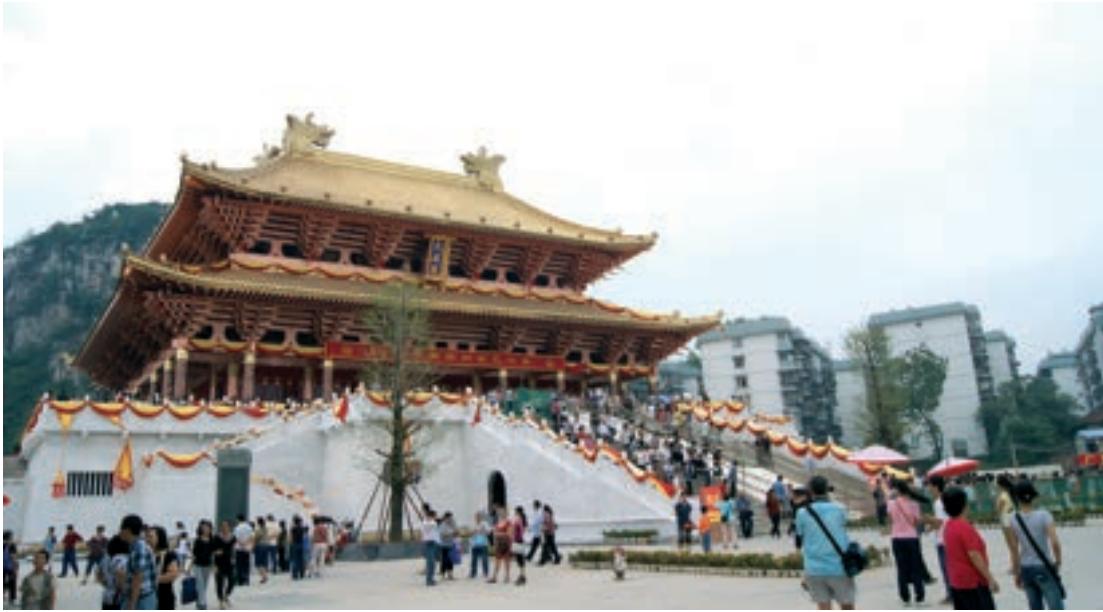
A Kultúra Istenének temploma, Guangxi tartományban. Itt Konfuciuszt imádják Wen Di, azaz a Kultúra Istene néven

Gondosan ügyelt a rendre, sokat adott öltözetére. A természethez is igazságos irgalommal viszonyult: halat csak horoggal fogott, hálóval soha, madárra is csak olyankor vadászott, amikor azok nem a fészükben ültek. Belátta, hogy ő sem született az igazság ismeretével, és hogy habár akadhatnak olyan emberek, akik képességeik segítségével felismerhetik, mi a helyes és eszerint cselekedhetnek, a maga számára azonban nem igényelte az igazság ismeretének ezt a legmagasabb fokát.