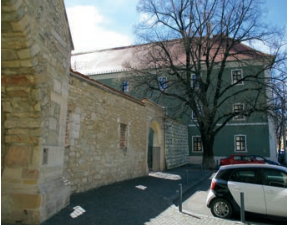
A régi, 17. századi református kollégium megmaradt fala Kolozsváron. A mögötte levő mai kollégium 1801-re lett kész