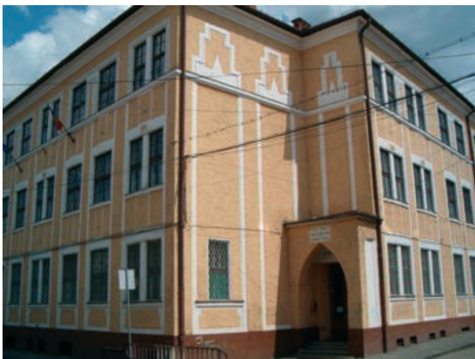
Az Apáczai Csere János Líceum Kolozsváron

1656 nyarán családjával átköltözött Kolozsvárra. Gyümölcsöző évek következtek. Mégpedig három – mert ennyi ideje maradt még e földön. Pedig nem volt könnyű. A régi iskola addigra romokban hevert, az új azon év tavaszán leégett. De ő nem csüggedt, hanem végiglátogatta a tehetős polgárokat. Pénz gyűlt, az épületet rendbe tette, s új termet is épített hozzá. Tankönyvek, taneszközök lettek beszerezve. Apáczai számos tantárgyat tanított, írt, alkotott. Az idő teltével szinte a gyulafehérvári kollégium szintjére emelkedett a kolozsvári iskola. És jöttek mindenhonnan a