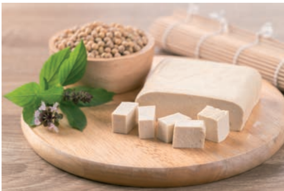
Tofu, vagyis szójatúró

Csökkenti a méh- és emlőrák kockázatát: kaliforniai tanulmányok világosan mutatják, hogy az