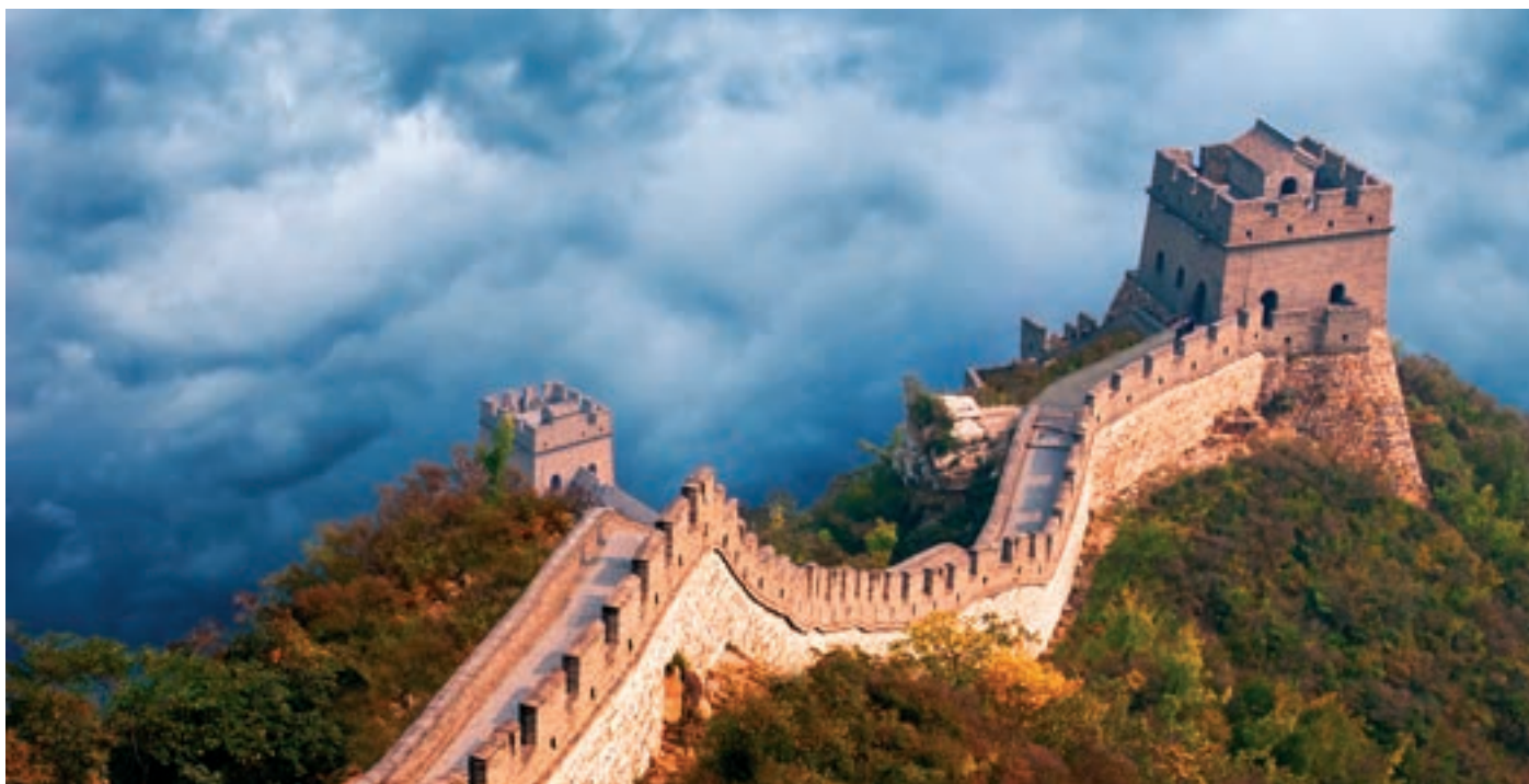
A Kínai Birodalom egyik fő jelképe, a Kínai Nagy Fal. Az i.e. 7. században kezdték építeni, s még az i. sz. 14–17. századokban is bővítették. Részlete Peking közelében

Jelenti azonban a bölcs utat is, amely a célhoz vezet. A korzakokon át ugyanakkor különböző módon értették a tao-t: személytelen törvénynek , ősanynak, személyes lénynek vagy akár istennek. Konfuciusz szerint a tao törvény, amely által az ég rendben tartja a természetet. A későbbi taoisták eltérő módon magyarázták a tao lényét, egyesek szerint valami felfoghatatlannak képzelték el, mások személyes lénynek. Míg a konfucianizmus – mint látni fogjuk – a társadalmi életre, szokásokra és megoldásokra fektette a hangsúlyt, a taoizmus inkább a természet és természetfeletti dolgokkal foglalkozik.