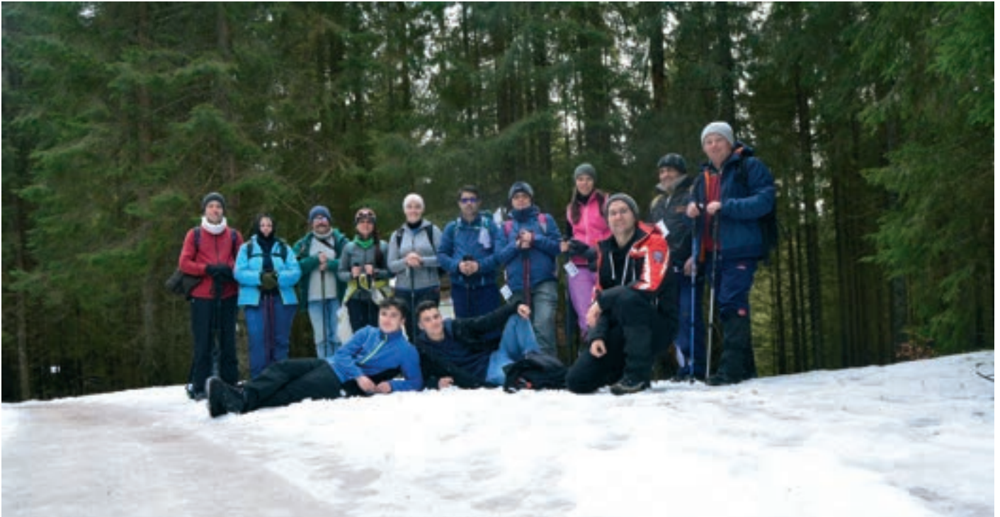
Az e téli imatúra résztvevői