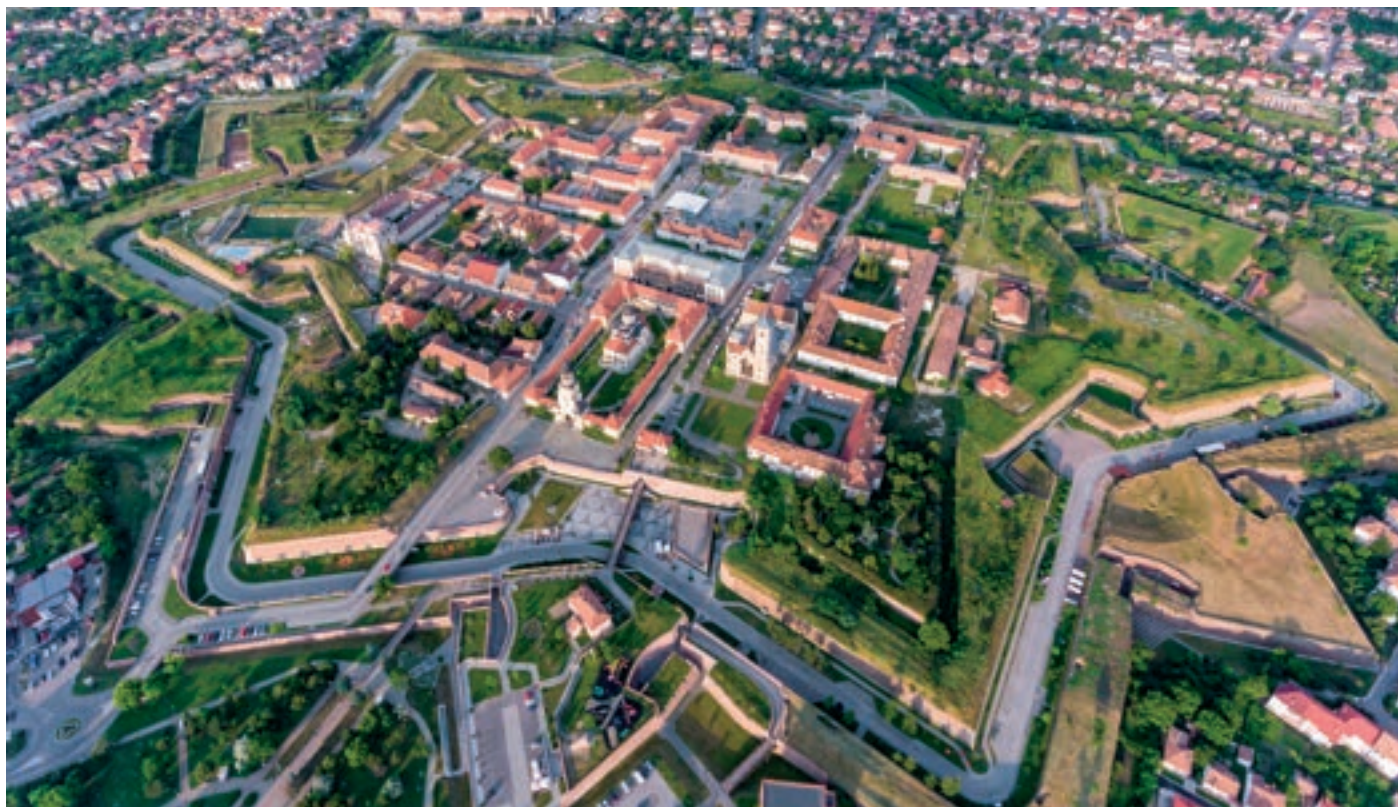
A gyulafehérvári vár napjainkban (a Habsburgok által épített 18. századi, csillag alakú Vauban-típusú erődítményben)