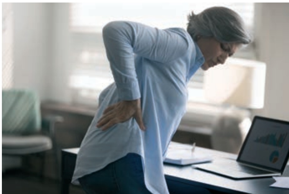
A mozgáshiányos életmód, a helytelen táplálkozással együtt az egész szervezetet rombolja

Alzheimer-kórt nevezik el 3-as típusú diabétesznek, mivel erre a demencia-típusra jellemző az agyban kialakult inzulinrezisztencia. Ezt az új terminológiát az orvosi szervezetek többsége nem fogadta el. Azonban nem csupán a 2-es típusú cukorbetegség segíti elő az Alzheimer-kórt, hanem az inzulinrezisztencia-szindróma is.