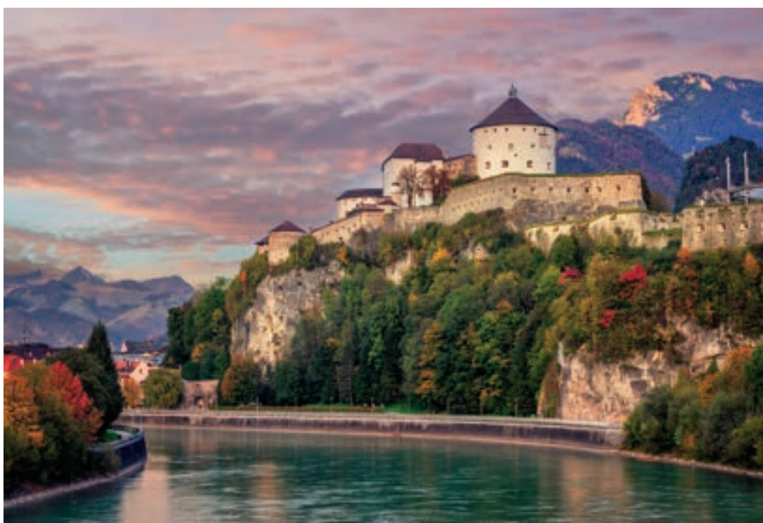
Ahol a Habsburg uralom ellen lázadó megannyi magyar is raboskodott: az Inn partján épült Kufstein várkastélya Tirolban, Ausztriában

A nyolcvankilenc utáni demokrácia beköszöntével reméltük, hogy ennek vége. De mi sem áll