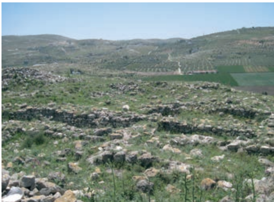
Az ókori Dótán romjai (ma Tel Dotan, palesztin területen)

Mert ne gondolja senki, hogy minden egyes telefont, vagy táblagépet napi 24 órán át egy valahol megbúvó, valódi emberi lény figyel. Nem, ezek az idők már lejártak. Hanem: számítógépes programok, algoritmusok rögzítik, elemzik írott-kimondott szavainkat – most még állítólag csupán üzleti okokból. De ki szavatolja azt, hogy mikor a digitális bilincs végül tökéletesen összecsatlan életünk minden apró-cseprő területe felett, akkor a háttérben levő, hozzánk hasonlóan bűnös, bukott emberek nem-e fognak visszaélni e hihetetlen hatalommal? Hiszen eddig a történelem minden korszakában bebizonyosodott, hogy csak a kellő alkalom szükséges ahhoz, hogy az ember embernek farkasává váljék.