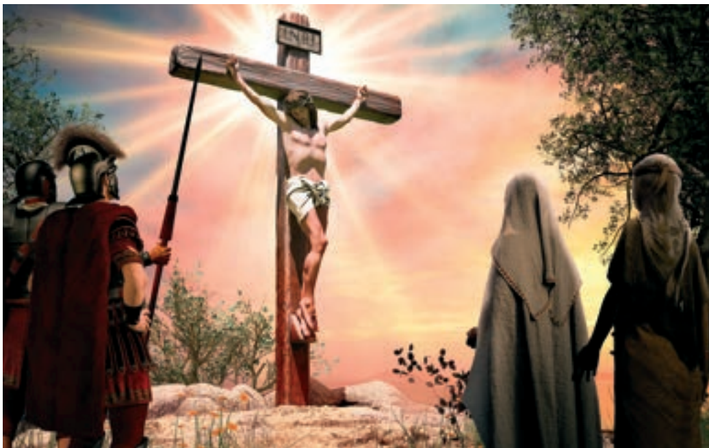
Amikor Jézus visszajön, egy rövid időre fel kell támadniok az Ő megfeszítéséért felelősöknek is

„Igazságban ítéli a gyöngéket, és tökéletességben bíraskodik a föld szegényei felett; megveri a földet szájának vesszejével, és aj-