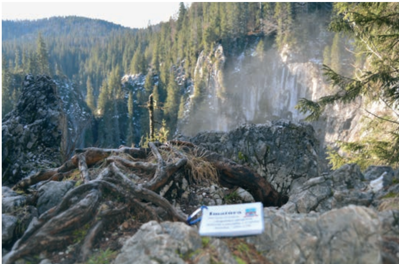
A Csodavár második dolinája (víznyelője)

Első kirándulásom a Csodavárhoz kielégítette sokévi kíváncsiságomat. Második alkalommal, e télen a táj szépségén túlmenően az igazi élményt az ott szervezett imatúra jelentette számomra. Hálát adok elsősorban Istennek,