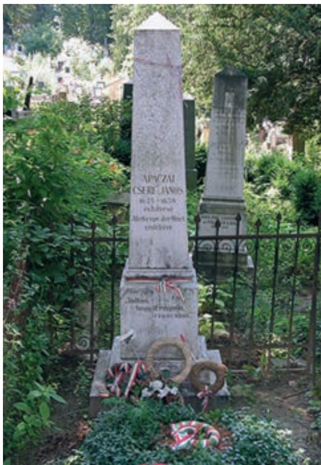
Apáczai síremléke a kolozsvári Házsongárdi temetőben

diákok, még a fejedelmi székhelyről is, oda, ahol magyar nyelven tanították az összes tudományt. Tanítványai közül itt megemléhetjük a számára legkedvesebbet, Bethlen Miklóst, Erdély későbbi kancellárját.