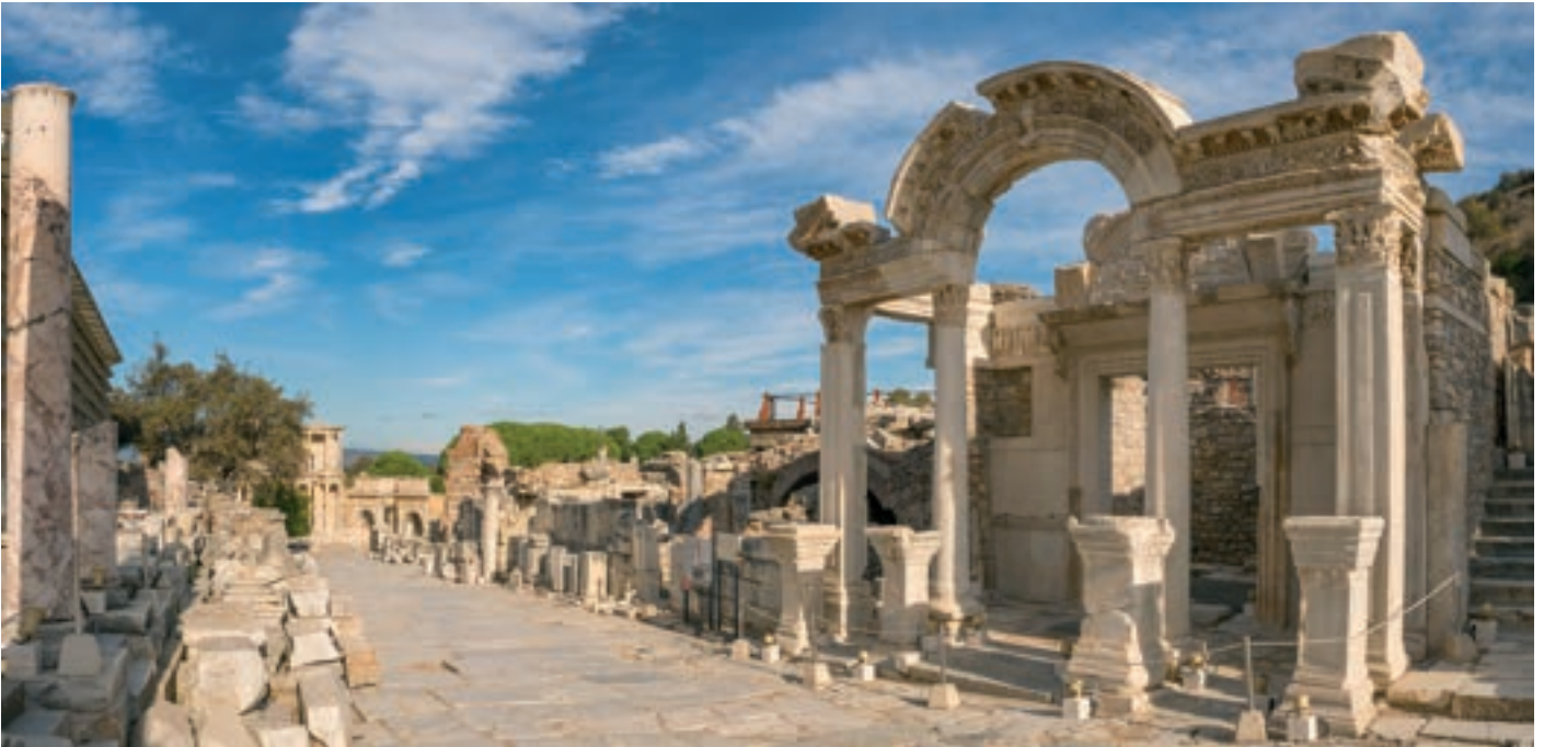
Az efézusi gyülekezetet Pál alapította, és sokat foglalkozott vele. Efézus romjai a mai Törökországban