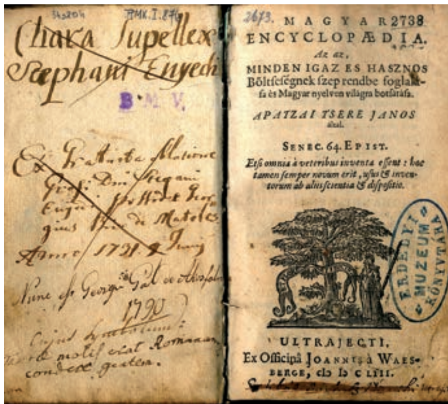
A Magyar Encyclopaedia egyik fennmaradt példányának címlapja

a parlament seregei között. Mivel Basire hű királpárti volt, 1646-ban menekülnie kellett az országból, hátrahagyva feleségét és öt gyermekét, akiket csak tizenöt év múltán láthatott újra.