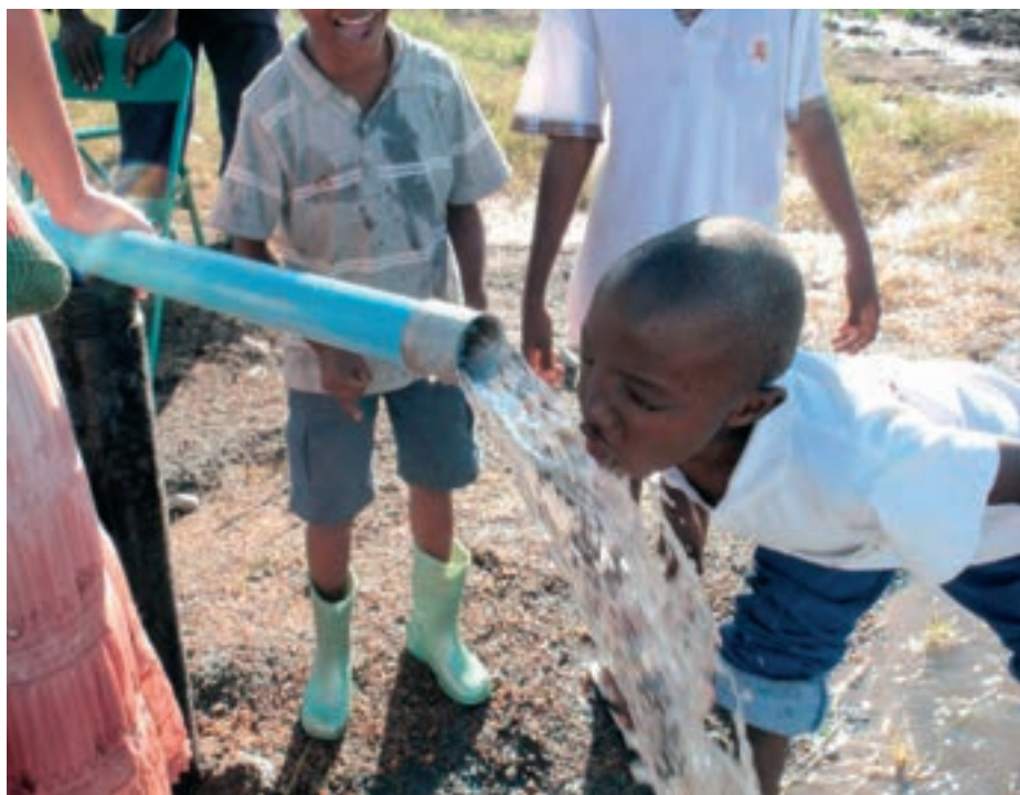
Vannak keresztények, akik úgy érzik: Isten arra hívta el őket, hogy kutak fúrását segítsék elő Afrika víztelen vidékein

Összeállította: Farkas Győző, lelkész, Zilah