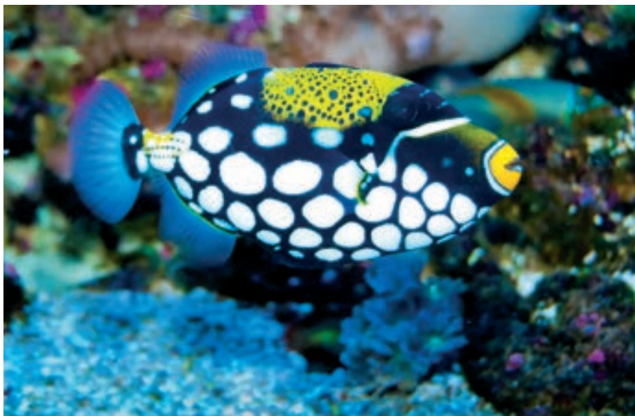
A Teremtő egyik mesterműve: a bohóc íjhal. Fél méteresre is megnőhet, és az Indiai-, meg a Csendes-óceán nyugati (Ázsia felőli) részének lakója

Ami igaz volt három és félezer évvel ezelőtt Jób és kortársai idejében, úgy ma is: bármely mű egy üzenet az őt létrehozó Mester részéről. Más szóval, egy olyan világban élünk, amelyben mindenhol kitűnik az okozat elve. A ház, amelyben laksz, azért létezik, mert valaki valamikor megtervezte és felépítette. Magától nem lett a falu vagy a város sem, ahol élsz. Vegyél a kezébe egy könyvet! Annak is van egy vagy több szerzője. Függsz a falon, vagy ketyeg a polcon óra a szobádban?