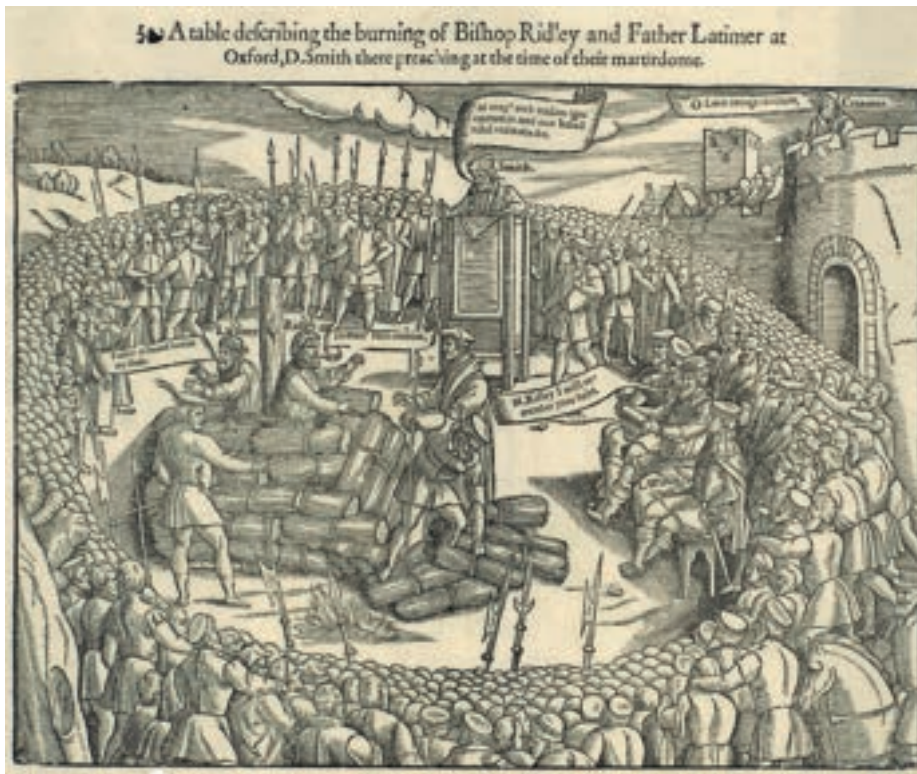
Hugh Latimer és Nicholas Ridley máglyahalála 1555-ben. Illusztráció John Foxe: Mártírok Könyve című művében (1563)

E reformátorok ugyanazt a nagyszerű elvet vallották, mint amit a valdensek, Wiclif, Husz János, Luther, Zwingli és a hozzájuk csatlakozók. „Halálra méltó bűnük” az volt, hogy hitték: a Szentírás az egyedüli tévedhetetlen tekintély, a hit és a cselekedet egyedüli szabálya. Ugyanakkor tagadták, hogy a pápáknak, a zsinatoknak, az egyházatyáknak és a királyoknak joguk lenne a lelkiismeretet vallási dolgokban irányítani. Számukra a Biblia volt minden tan és minden állítás próbaköve. Az Istenbe és Igéjébe vetett hit adott erőt e