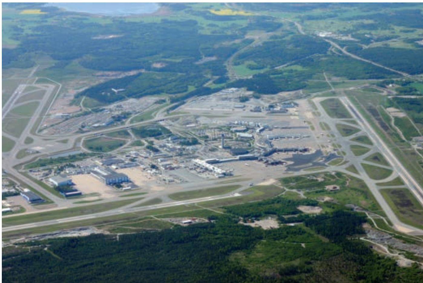
Svédország legnagyobb repülőtere, a Stockholmtól 37 km-re északra levő Arlanda reptér (Stockholm-Arlanda flygplats)

teljesen lenyűgözött minden... még addig sohasem jártunk külföldön! A terminált elhagyva, a reptéri vonatra szálltunk, mely bevitt a városba. Besodródtunk a leszálló utasokkal együtt egy nagy váróterembe, de úgy éreztük, teljesen el vagyunk vesztődve. Én a férjem mellett álltam, és próbáltuk kideríteni, merre tovább. Amint tanácstalanul ácsorogtunk, hirtelen letekintettünk a mellénk letett bőröndjeinkre – ám azoknak már csak hült helyét találtuk! A nagy tömegben hozzáértő tolvajok egy pillanat alatt elemelték őket!