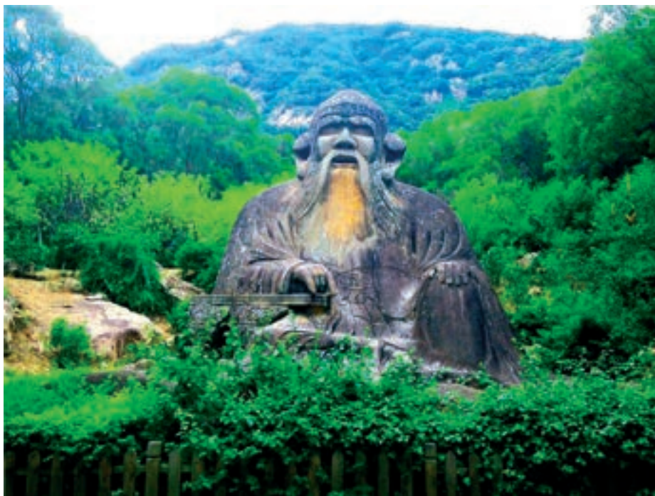
Hatalmas Lao-ce szobor Fudzsjan tartományban, a Csingjuan hegy lábánál

ponkénti újjászületés, és Jézussal való szoros kapcsolat révén, míg Sátánnak és démonjainak a tűztóban való, Isten általi elpusztítása egy történelmi esemény lesz. 3