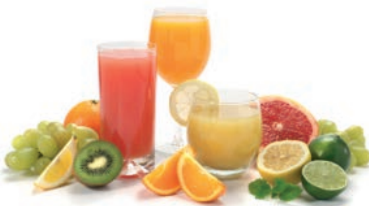
A friss gyümölcslevekben is csak mértékkel fogyasszunk

annál, ami fogazatuk kedvező fejlődését biztosítja, kizárva a fogszuvasodás okozta esztétikai és funkcionális problémákat? Válasszunk hát bölcsen abban, hogy mivel oltjuk a szomjunkat, hidratáljuk a testünket, és az életörömünket fejezzük ki ragyogó mosollyal!