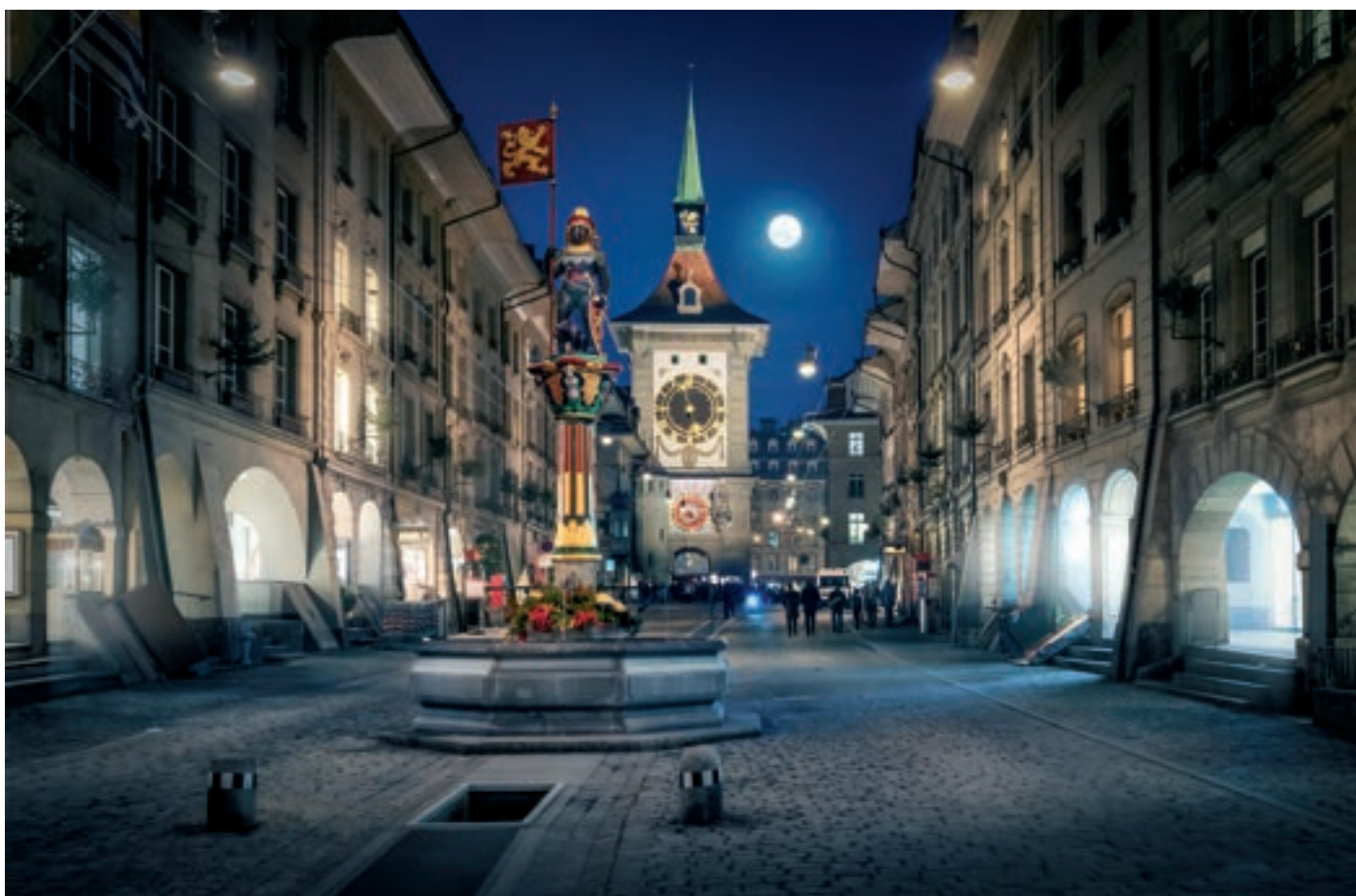
Senki sem gondolná, hogy Bern épületei maguktól lettek a semmiből. A Kramgasse (Élelmiszerbolt-utca), háttérben a Zytglogge (Idő-harang) tornyával