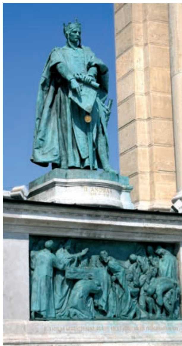
II. András szobra – Budapest, hősök tere

1217–18-ban a király szentföldi hadjárata zajlott, mely sok pénzébe került, s így rengeteg adósságot halmozott fel. Távollétében az ország kormányzását János esztergomi érsekre bízta. Mire hazatért, zűrzavaros állapotok fogadták, s időközben a fő-