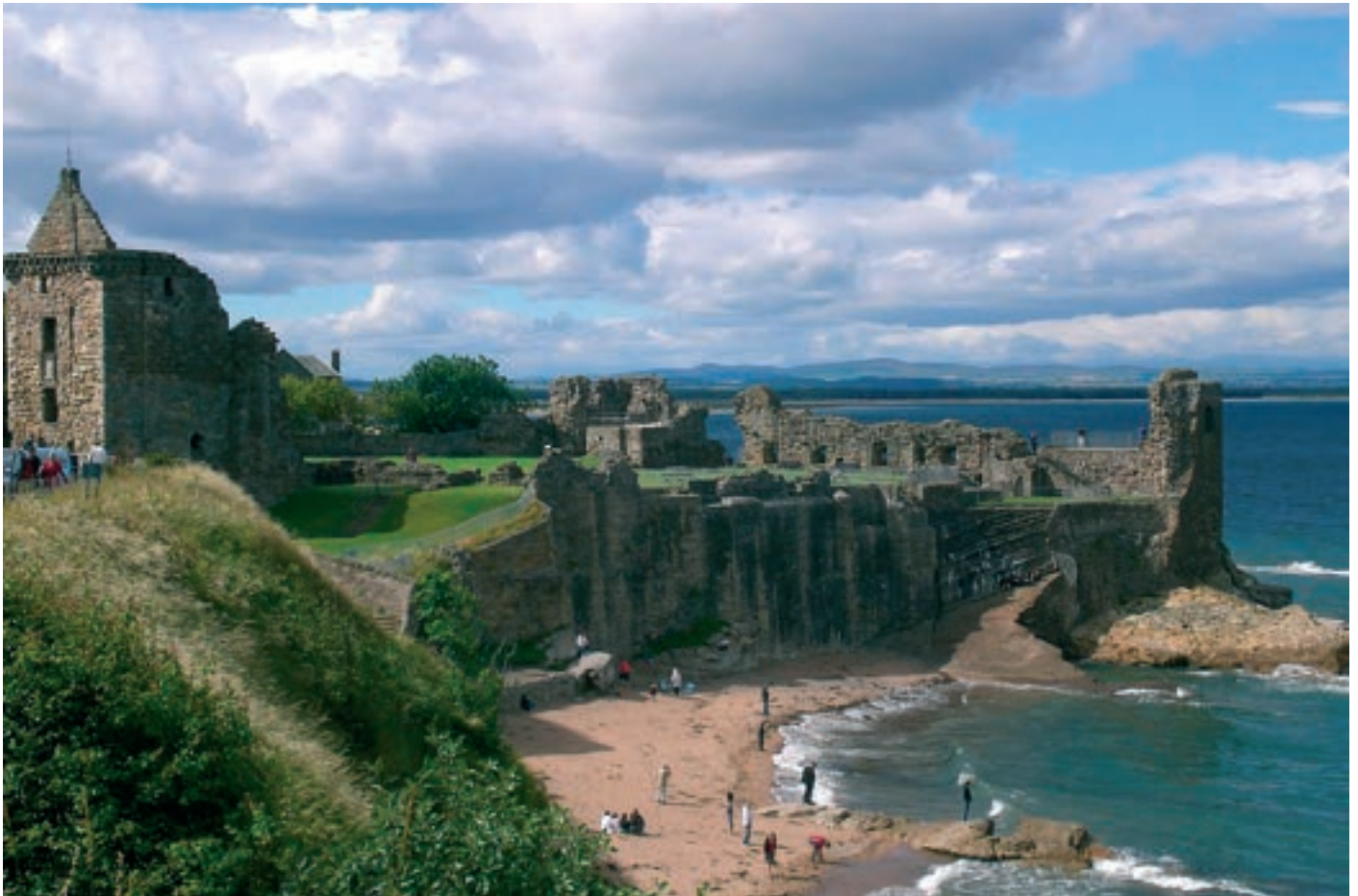
Ahol John Knox az első prédikációját elmondta, s ahol gályarabságra is került: a kelet-skóciai Fife vármegyében levő tengerparti erőd, a St. Andrews kastély

nyezetébe kerülve nagy befolyást gyakorolt a Book Of Common Prayer (az anglikán egyház 1549-ben kiadott ima- és liturgiakönyve) megfogalmazásában. Csakhogy a hívő Edwárd csupán tizenhat évesen, 1553-ban meghalt, és a már említett nővére, a VIII. Henrik első feleségétől, Aragóniai Katalintól származó, Véreskezű Mária (Bloody Mary) került Anglia trónjára.