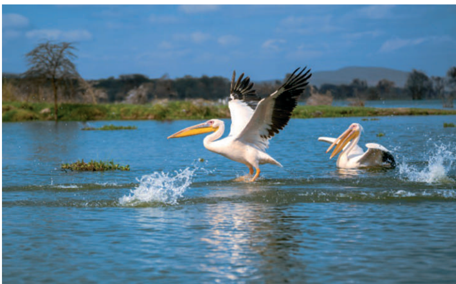
Fehér pelikánok Görögországban