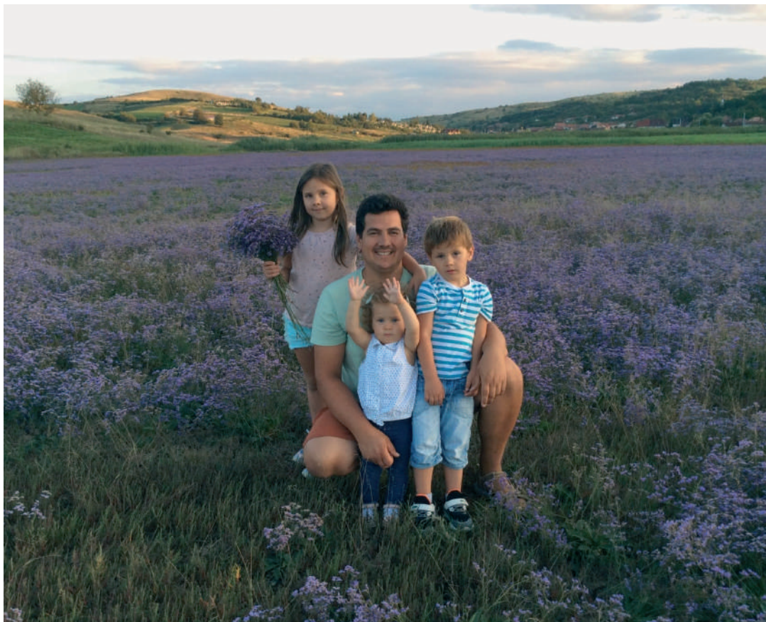
A falunk határában levő sóvirágmezőn