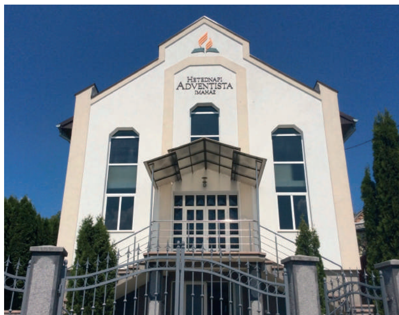
A széki imaházunk