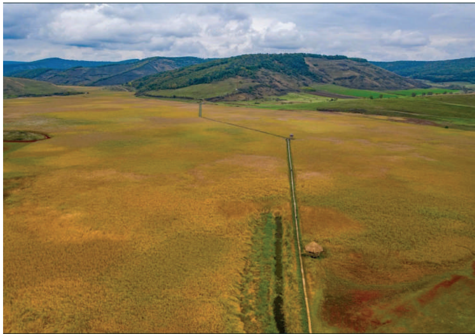
A széki nádas tavasszal