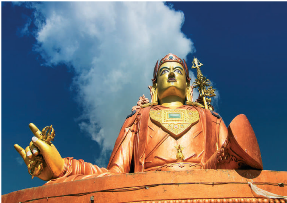
Az i.sz. 8. században élt Guru Rinpócsának, a Tibettel határos Sikkim indiai állam buddhista védőszentjének 45 m magas szobra, Namchi városa mellett

Valamennyi vallás közül a buddhizmus hangsúlyozza legerősebben az élet mulandóságát és értelmetlenségét, híveit a hindukkal ellentétben mégis a víg kedély jellemzi. Ezt úgy éri el, hogy a Nirvána felé irányítja híveinek figyelmét, ahol a szenvedés véget ér.