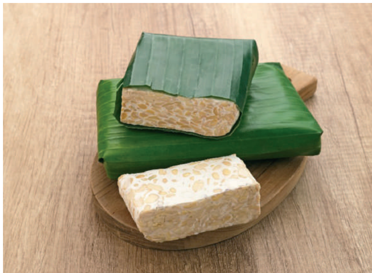
Banánlevélbe csomagolt tempeh. Ez egy ősi, jávai (indonéz) szójatermék. Az itt látható félig főtt, fermentált, és egy fajta gombával beoltott szójabab-tömböt szeletekre vágják, fűszerezik, majd olajban kisütik

a szűkös esztendőkből elsősorban a növényi olaj és fehérjeforrás volt úgy Európában, mint Észak-Amerikában. Az 1950-es évekre azonban a szója visszasüllyedt