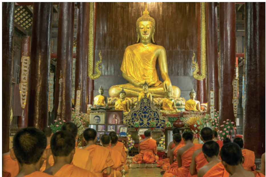
Hatalmas arany Buddha-szobor előtt meditáló szerzetesek. Phan Tao templom, Thaiföld

A nirvána szanszkrit ige jelentése: elfűjni , s a buddhista tanítás szerint arra utal, hogy amikor a lélek ide kerül, kialszik benne a gyűlölet, kapzsiság, érzékiség, stb. lángja.