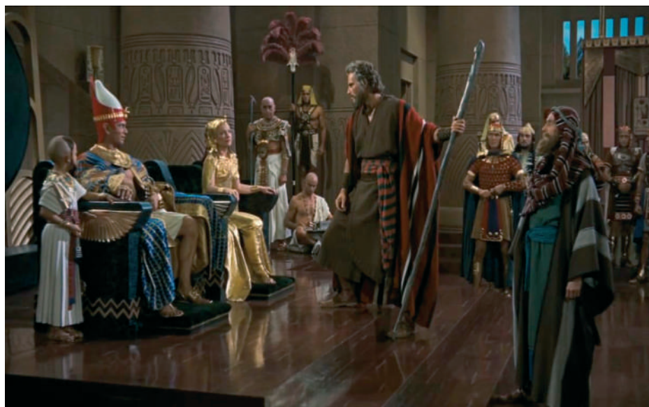
A Fáraó és varázslói nem akadályozhatták meg a tíz csapást, sőt, Mózesnek és Áronnak sem árthattak. A végső hét csapáskor sem lehet Isten kezét megállítani, népe azonban megszabadul

2 „És az én szombatimat megszenteljétek, hogy legyenek jegyül én köztem és ti közöttetek, hogy megtudjátok, hogy én vagyok az Úr, a ti Istenetek.” (Ezékiel 20:20)