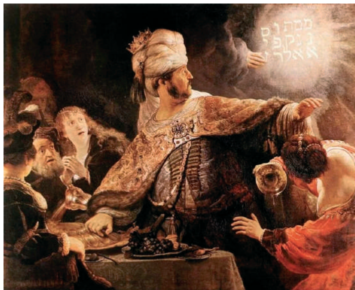
Belsazzár, az utolsó babiloni király istenkáromló dőzsölését egy titokzatos kéz szakította félbe. Azon az éjjelen, az Eufráteszt elterelve, a méd-perzsa seregek el is foglalták a várost. Belsazzár lakomája: Rembrandt van Rijn (1606–1669) festménye

Az Eufrátesz kiszáradásáról tudni kell, hogy Babilon városa, Belsazzár idejében (éppen azon az éjszakán amikor a titokzatos kéz felírta a falra a Mene, mene, tekel, ufarszin szavakat – lásd Dániel 5.fejezetét) úgy esett el, hogy a médek és a perzsák elterelték a városon átfolyó Eufrátesz felső folyását, s az így kiszáradt folyómedren át vonultak be a városba. A médeken és a perzsákon ez időben két király, a méd Dáriusz, és a perzsa Círusz uralkodott. Ők azok a keleti királyok, akiknek segítségével annak idején lehetővé vált a zsidó nép babiloni fogságból való hazatérése, s akik jelképszerűen az