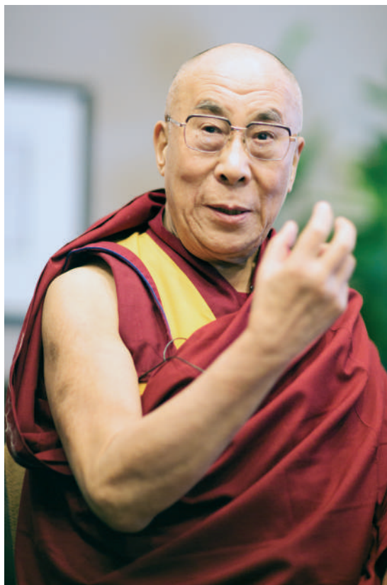
Tenzin Gyatso jelenlegi Dalai Láma

tehát nincs Isten , aki parancsolatokat ad és ezek be nem tartását bünteti, nem léteznek bűnök sem .