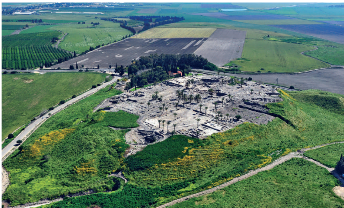
Az ókori Megiddó romjai a mai Izrael területén (Tel-Megiddo)

És nagy jégeső, mint egy-egy tálentom, szálla az égből az emberekre; és káromlák az Istent az em-