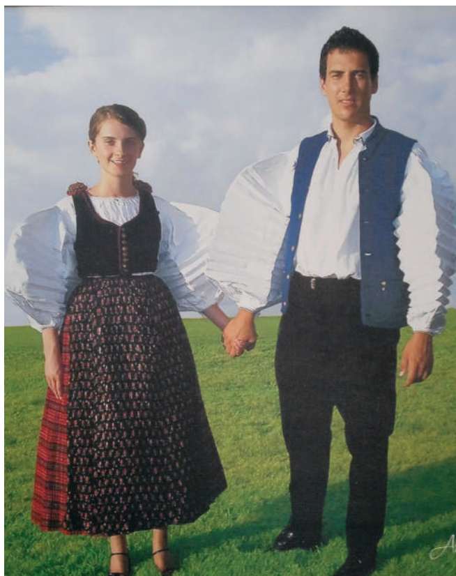
Az udvarlási időszak idején, 2008-ban

iskolát itt a községben, Széken végeztem el, majd kilencediktől a kolozsvári adventista iskolába, a Maranatha Líceumba mentem. Itt már csak románul indult osztály akkoriban.