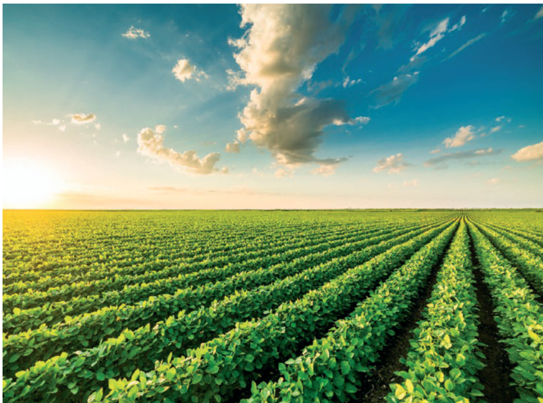
Szójaültetvény az Egyesült Államokban

Kínában a fiatal növény leveleit főzelékként eszik. Mandzsúriában és Észak-Koreában a szójalevél dohánypótló. A péppé dörzsölt szójalisztet vajként fogyasztják, de ismert a szójaital, a szójasajt, a szójamártás, a szójaolaj, a szójacsira, a szójakocka, pástétom és – pörkölt szójababból – a szójakávé is, valamint egyéb szójakészítmények. A szójatermékek legnagyobb része ma