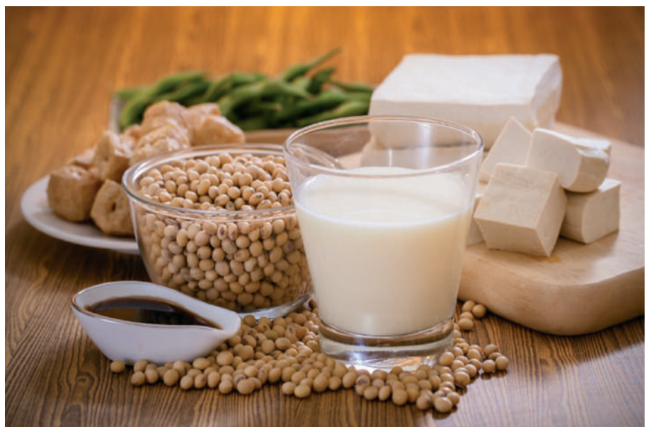
Szójatermékek (szójatej, szójatúró, azaz tofu, szójaszós, stb.)

Az orvosi szakirodalomban elsőként számoltak be lektinmérgezésről, amikor „estebédet készítették” egy zacskónyi babból, melyet egy serpenyőbe öntöttek és éjszakára beáztattak, de végül nem főzték meg, s úgy ettek belőle. De a babot, ahhoz, hogy valóban ehettőre puhuljon, vagyis villával könnyen szét tudjuk nyomni, legalább egy óráig kell főznünk. Tehát mire az ízletes bableves elkészül, a lektintartalmának nyoma sincs. Egyesek azal is próbálkoztak, hogy főtelen vesebabot tegyenek az úgyne-