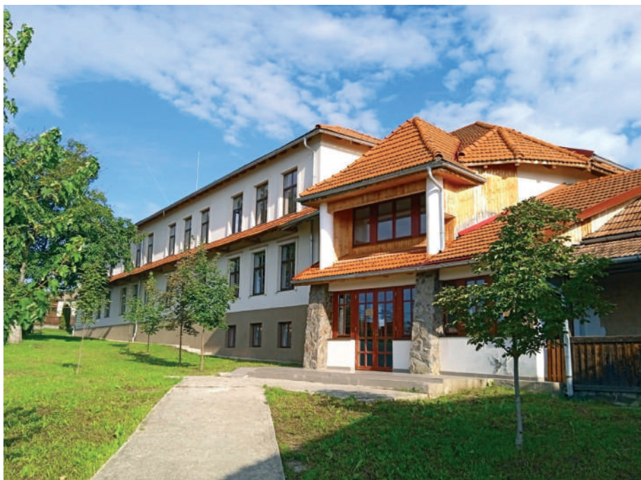
A széki iskola