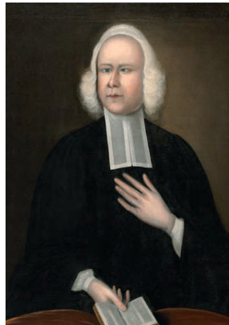
George Whitefield-et szembetegsége nem akadályozta meg abban, hogy egy életen át az Igét hirdesse

– Tudtam! Egyszerűen tudtam, hogy a sok szép dolog ellenére,