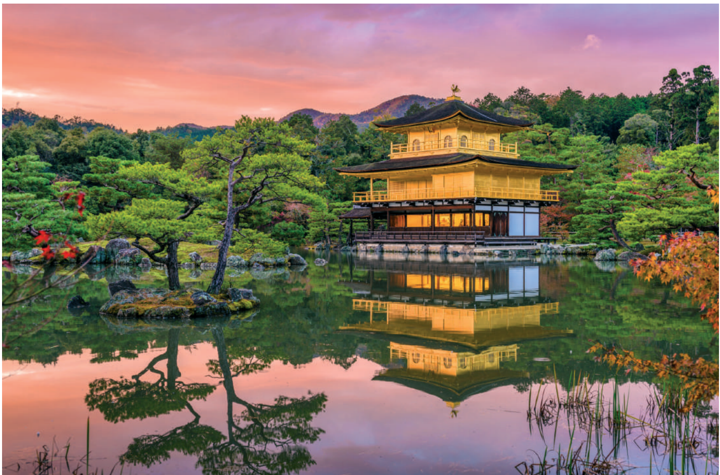
Az Arany Pavilon zen buddhista templom, Kiotó, Japán. A zen a mahájánában gyökerezik

Az első évezredben a buddhizmus különböző okok miatt elkezdett veszíteni népszerűségéből, Tibetben azonban a egyre nagyobb szerepet játszott úgy a szellemi, mint a kulturális és az állami életben. Az évezred vége