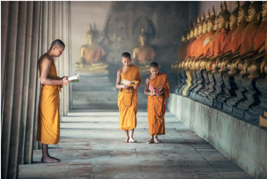
Szerzetes-tanoncok egy buddhista kolostorban. Ayutthaya tartomány, Thaiföld