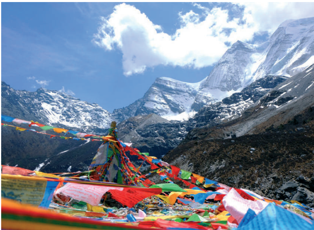
Imazászlók Tibetben, a Tej-Tóhoz vezető úton

fele, a tizenkilencedik században, új érdeklődést nyert a nyugati világban. Ez a változás a háromszéki születésű híres kutatónak, Kőrösi Csoma Sándornak (1784-1842) köszönhető, aki a keleti országok és kultúrák tanulmányozása révén elkészítette az első tibeti-angol szótárt, és lefordította angol nyelvre Gautama írásait és más fontosabb írásokat.