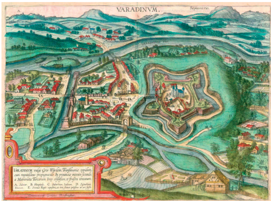
Várad térképe, 1617 – a vár és a város

polgárháborút a két uralkodó hívei között.