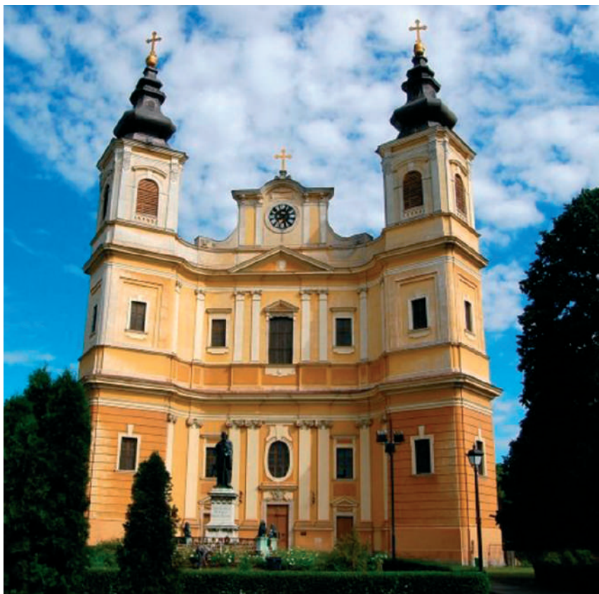
A barokk stílusú, római katolikus székesegyház (1779)

1830-ban a sebes-körösparti városnak 18 ezer lakosa volt. 1880-ra ez a szám 31 ezerre nőtt. Ezeknek kb. 60 százaléka volt magyar (katolikus és református) és