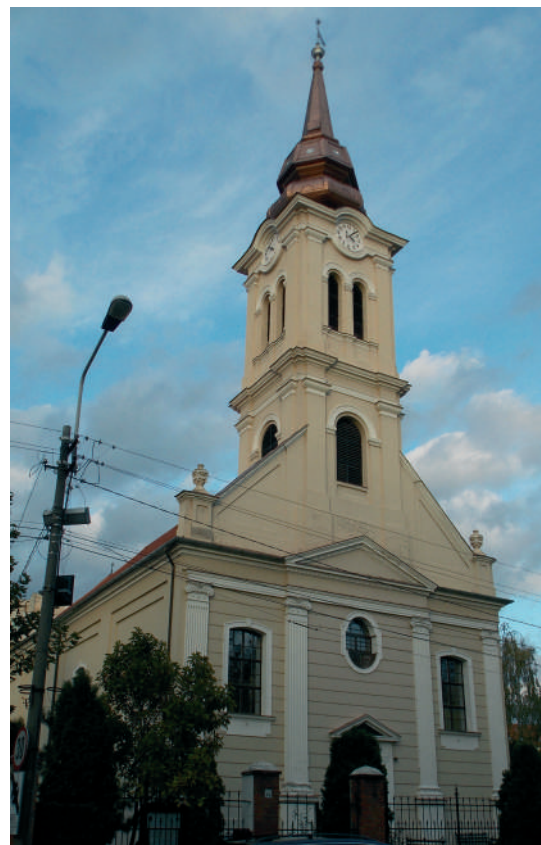
A váradolaszi református templom (1787)