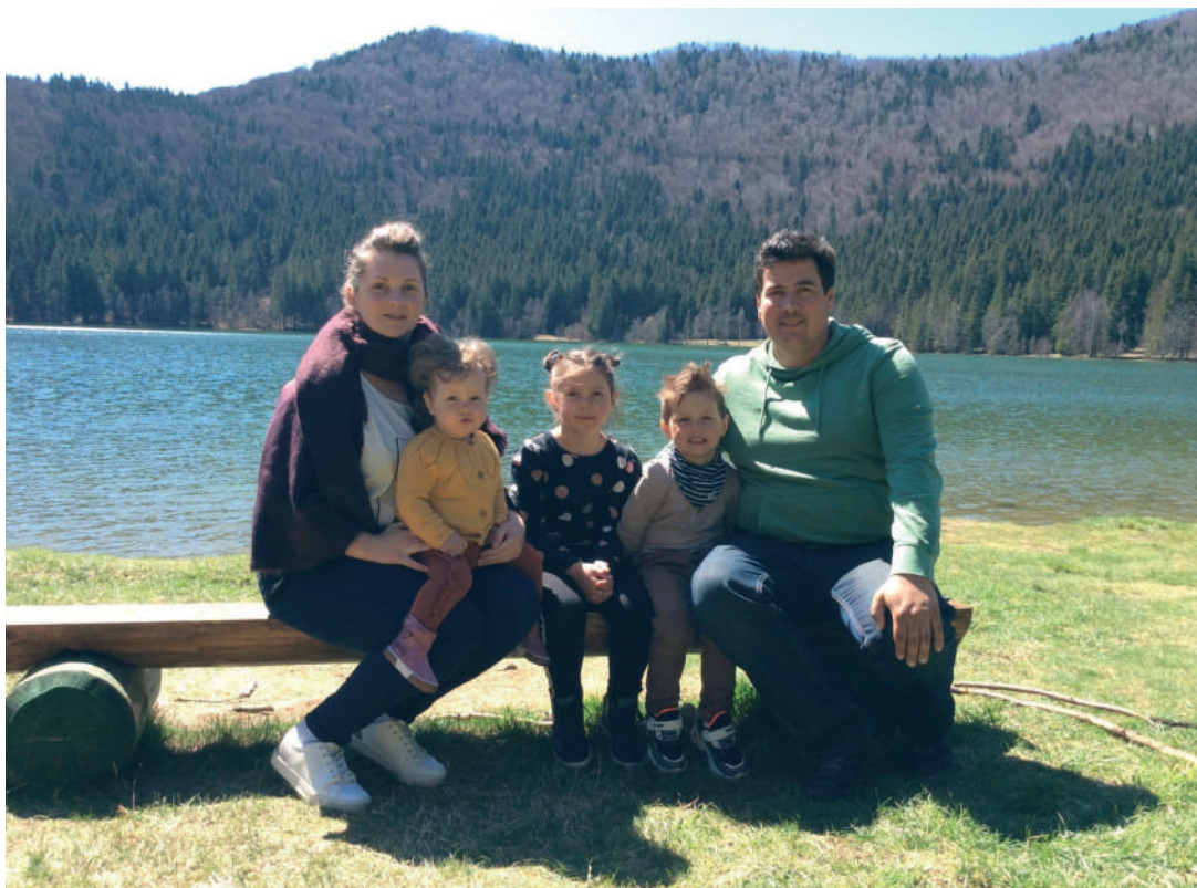
A Szent Anna-tónál, 2021-ben

igazi, összetartó család, olyan életet élve, ami teljes az Isten szemében.