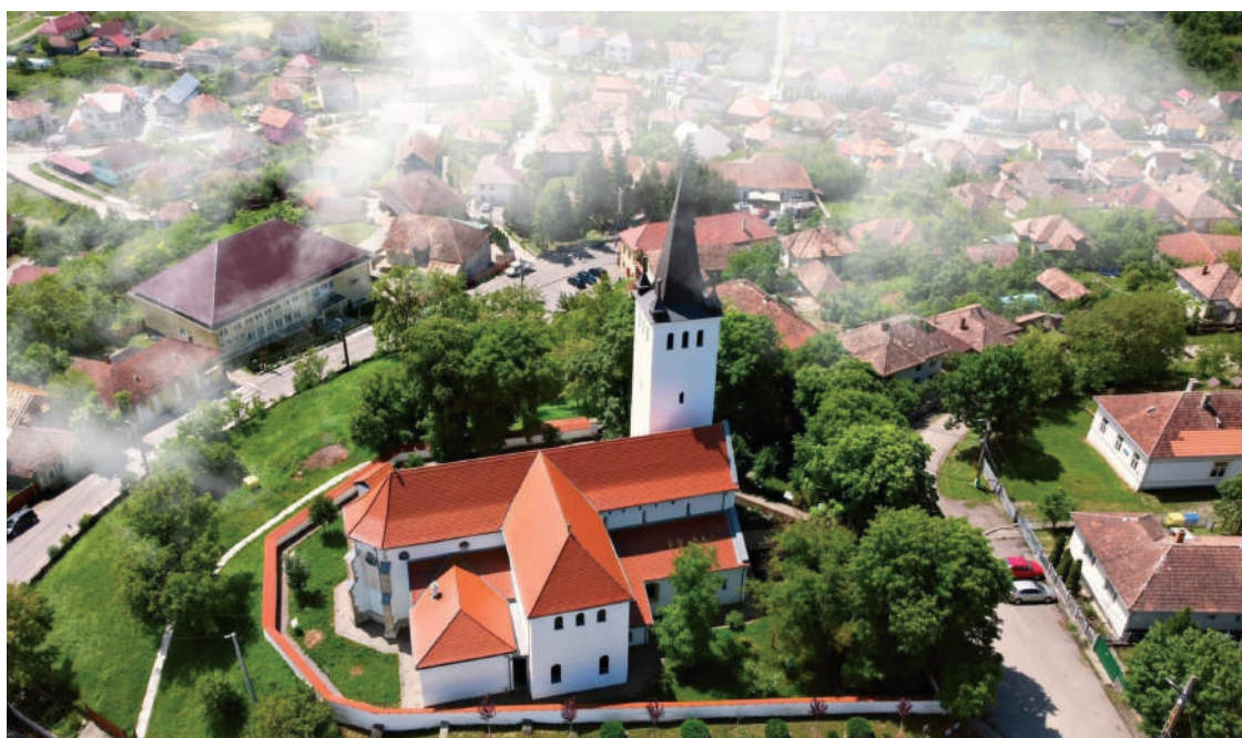
A széki, középkori református templom

– Azt jelenti számomra, hogy minden nap nemcsak hiszem, hogy az Úr megsegít, ha-