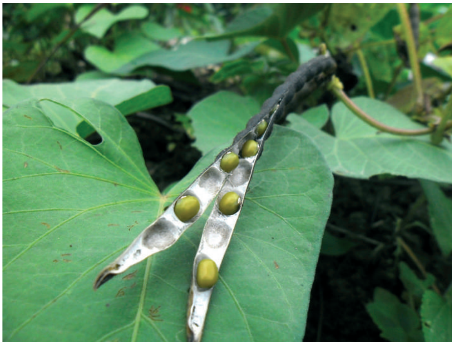
Mungó szója, Hong Kong

Karógyökere 1,5-2 méter mélyre hatol le a talajba, de az oldalelágazások és a hajszálgökerek zöme a talaj felső, 20-30 cm-es rétegében található. A szára, levele, és termése finom, barna szőrrel borított. A levél alakja fajtánként változó, kerek tojásdadtól a keskeny lándzsásig terjedhet. Jelentéktelen, önbeporzó, laza fürtvirágzata a levelek hónaljában foglal helyet. A virágok színe lila, rózsaszín vagy fehér. Hüvelytermése a borsóéhoz hasonló, 3-5, belül szivacsos hüvelyből álló csoportokat alkot, amelyek 3-8 cm hosszúak, és amelyekben 2-4 magnál ritkán található több. A szója magja a babhoz hasonlóan lapított, és fajtától függően igen változatos alakú és színű lehet: van vese vagy gömb alakú, sárga, barna, olívazöld, fekete színű vagy márványozott mag is. A héja kemény, sérülésre igen érzékeny. A sérült mag nem csírázik ki.