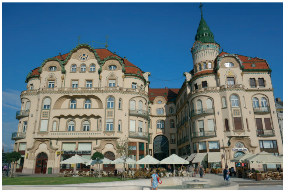
A Fekete Sas szálloda (1909)

26 százaléka zsidó. A németek aránya 4 százalék volt, kb. 1.200 fő.