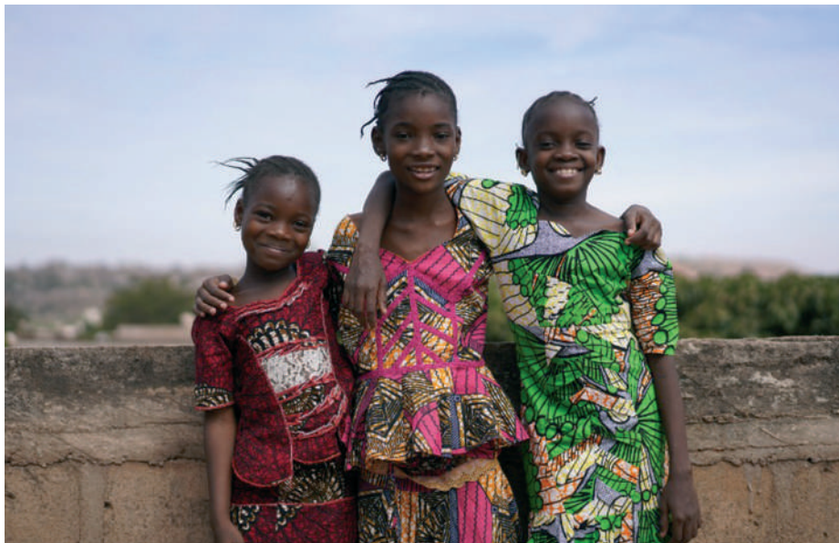
Isten minden teremtett gyermekét egyformán szereti

Sajnos mindig minden időben voltak és lesznek, akik nem tudnak, és nem is akarnak egységben élni, sem a családban sem a gyülekezetben. Az Úr Jézus tanítványai is küszködtek és szenvedtek emiatt, félreértették, ahogy Jézus a pogányokhoz, a samaritánusokhoz, vagy a bűnösökhöz és a szegényekhez viszonyult. Az előítéletek elvakították a tanítvá-