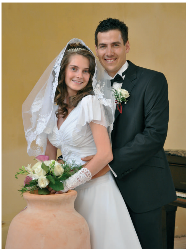
Esküvői fotó, 2010