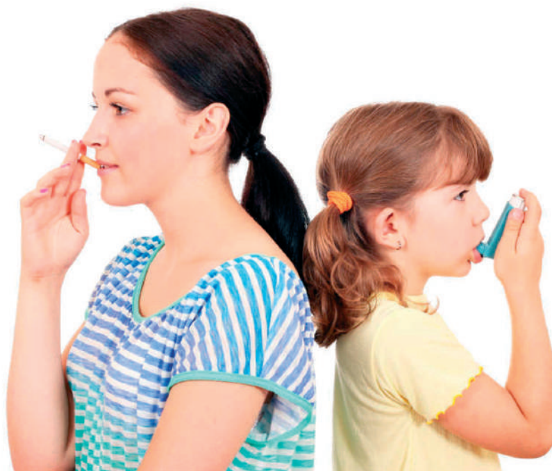
Vajon a dohányos szülő valóban szereti-e gyermekét?