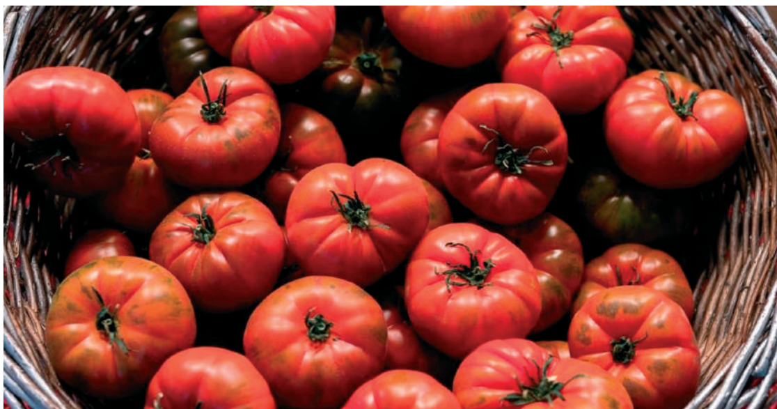
A paradicsomban a prosztatatarák megelőzésére alkalmas antioxidánst – likopént – találunk

nek , aminek legjobb forrása a paradicsom. A vitaminok közül a zsírban oldódó A-, E- és D-vitaminok tekinthetők védő jellegeteknek.