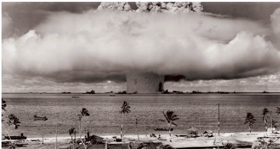
Amerikai, vízalatti nukleáris robbantás 1946-ban, a Bikini-atoll lagúnájában (Marshall-szigetek). A radioaktivitás miatt a szigetek azóta sem lakhatóak

„És abban az időben felkél Mihály, a nagy fejedelem, a ki a te néped fiaiért áll, mert nyomorúságos idő lesz, a milyen nem volt atól fogva, hogy nép kezdett lenni, mindezideig. És abban az időben megszabadul a te néped; aki csak beírva találta a könyvben.” (Dániel 12:1)