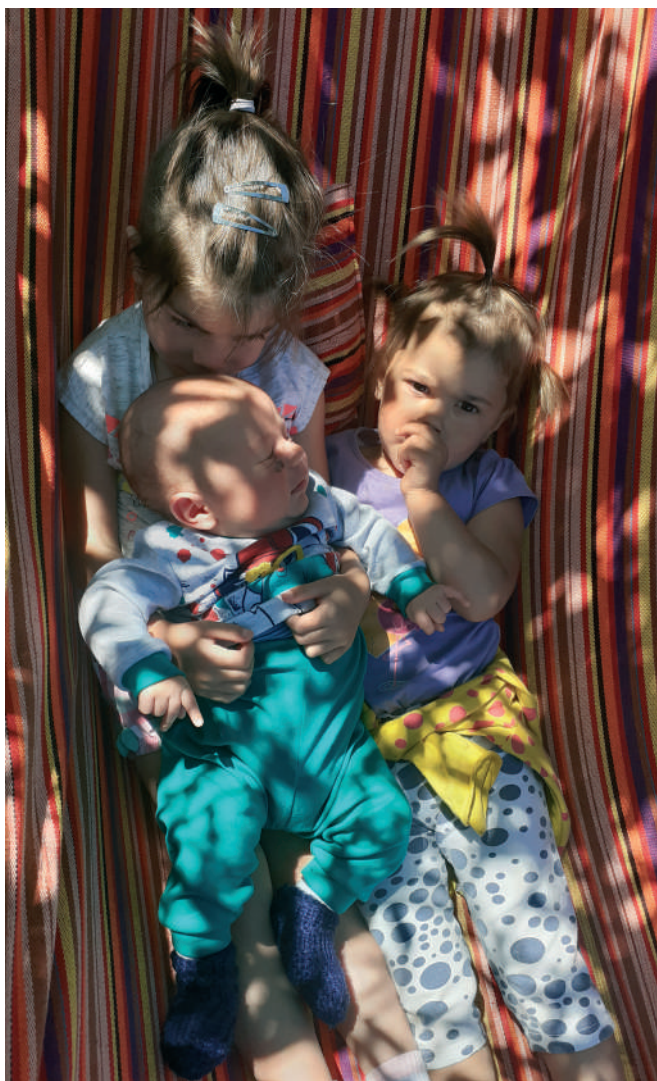
A szeretet kifejezésében példát vehetünk a gyermekeinktől: gyorsak a megbocsátásra, önzetlenek, ragaszkodóak

Vajon amikor megbánt a páruunk vagy a gyermekeink, akkor is ugyanolyan szeretettel tudunk feléjük fordulni, mint amikor kedvesek, gyengédek