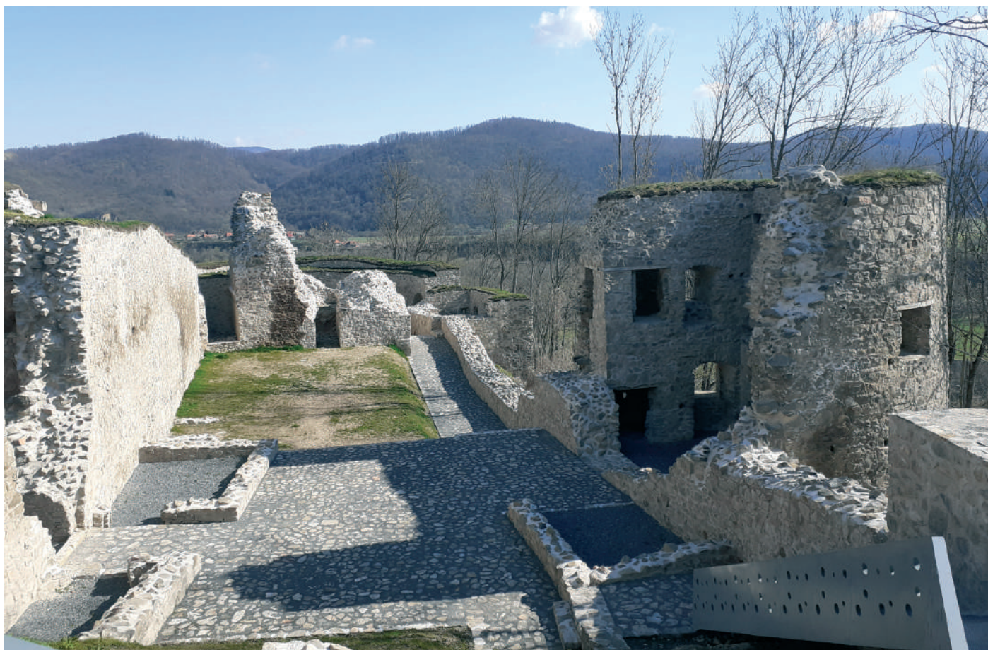
A Sebes-Körös völgyére néző Sebesvár romjai (Bánffyhunyad és Csucsá között)