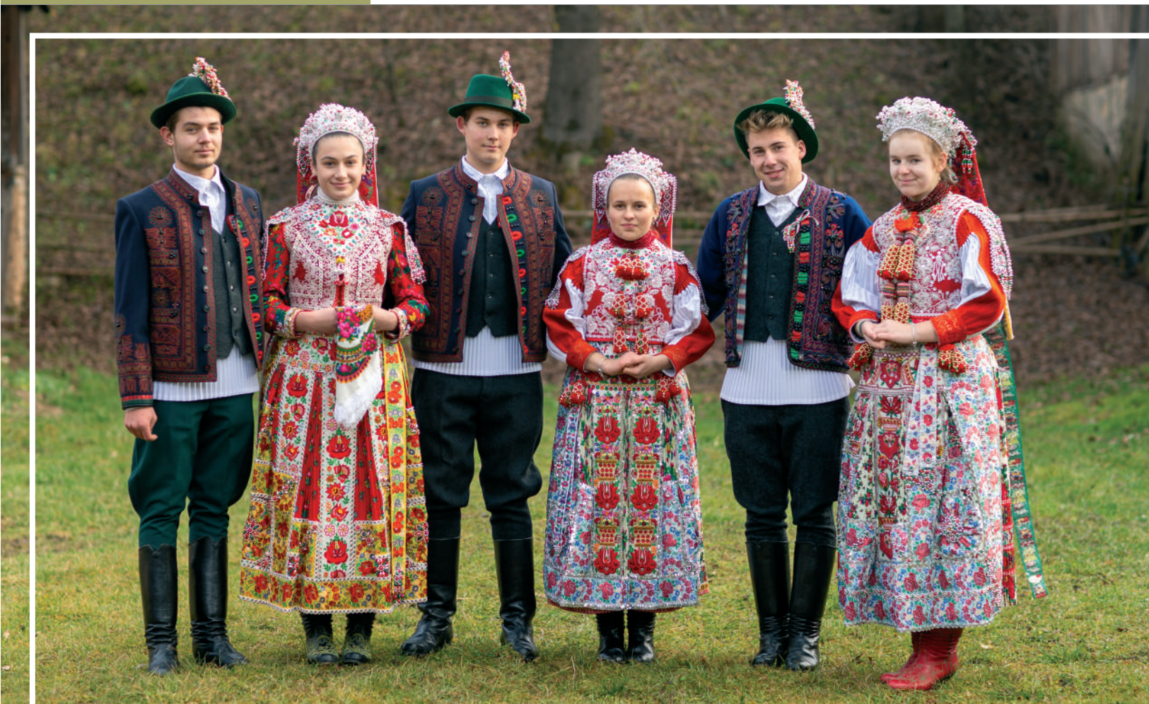
MÁKÓFALVI (KALOTASZEGI) FIATALOK HELYI VISELETBEN