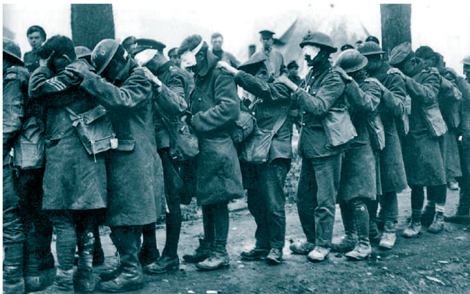
Megvakult katonák az első világháborúban

csak olyan éghajlatra vonatkozhat, amely a tüzet nélkülözhetővé teszi. Más szóval, itt nem egy me-rev szabályról , hanem a tilalom mögött meghúzódó elvről van szó: ne tegyünk meg az Úr napján olyasmit, ami elkerülhető lenne, amire nincs feltétlenül szükség.