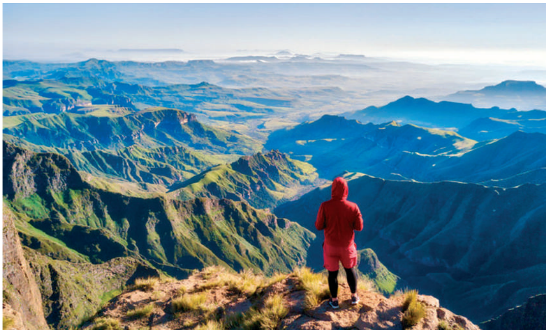
Aki a Felséges rejtekében lakozik, nem fél (Drakensberg-hegység, Dél-Afrika)

rablások, háborúk, nemi erőszak és kicsapongás, természeti katasztrófák, szerencsétlenségek, balesetek – ez az igazi hír. Ha egy városban százezer ember nagyobb baj nélkül vészelt át a napot, az nem hír. De ha a százezeregyedik ittasan fejszével esett neki a családjának, az már igen! Ennek illik minden vértfagyasztó részletét apránként bemutatni, az erre a célra kihegyezett riporterek által kóstolgatni, hadd