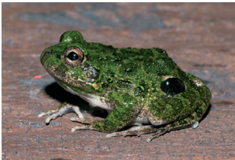
Szemfoltosbéka hímje (Uruguay)

A támadó a nagy szemek látán zavarba jön. Nem lehet biztos benne, hogy nem egy nagyobb méretű állattal találta-e szembe magát – hiszen a szemek távolságából és méretéből ez következne. Sőt, a béka behajlított lábai hatalmas szájnak tűnnek, testének vége pedig hegyes orrnak – és minden pontosan a