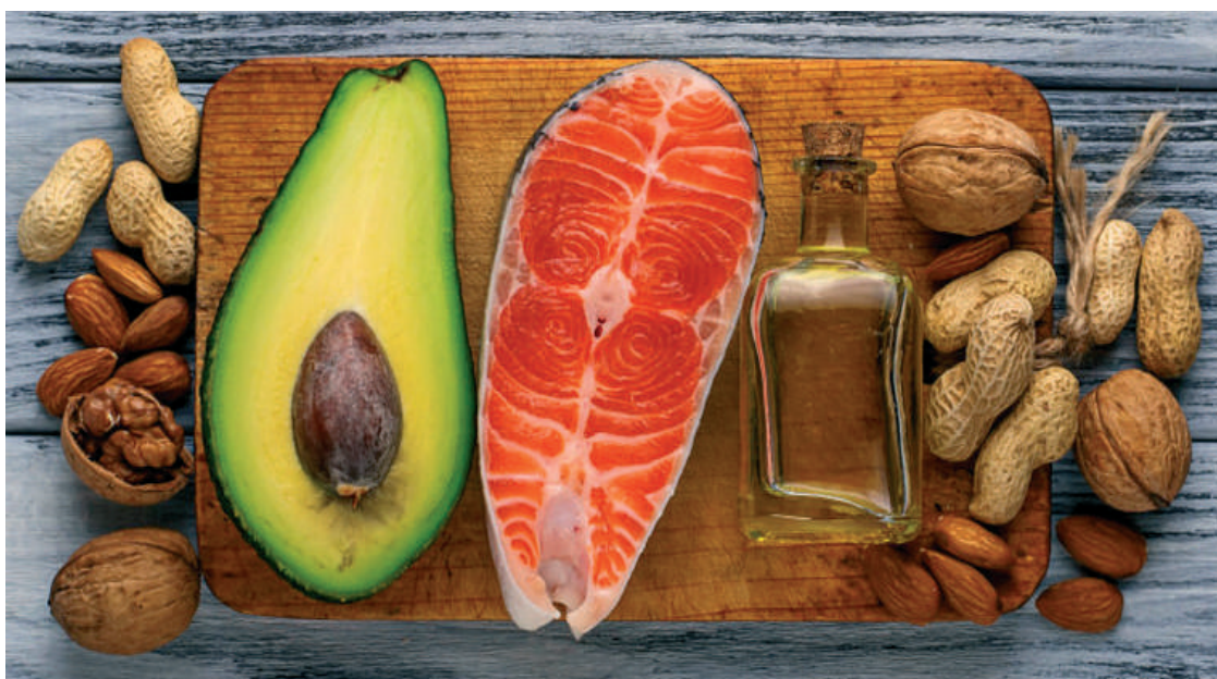
Húsételek, tejtermékek és a napraforgóolaj egyoldalú használata helyett éljünk az egészséges omega-3 zsírok forrásaival: Halak, dió, lenmag, olívaolaj, zöldségek, avokádó, mandula, stb.