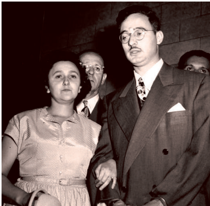
Ethel és Julius Rosenberg, a per idején

Ilyen a mi emberi természetünk: amíg a meleg szobában jóllakottan heverünk a tévé előtt, és a tragikus események távol zaj-