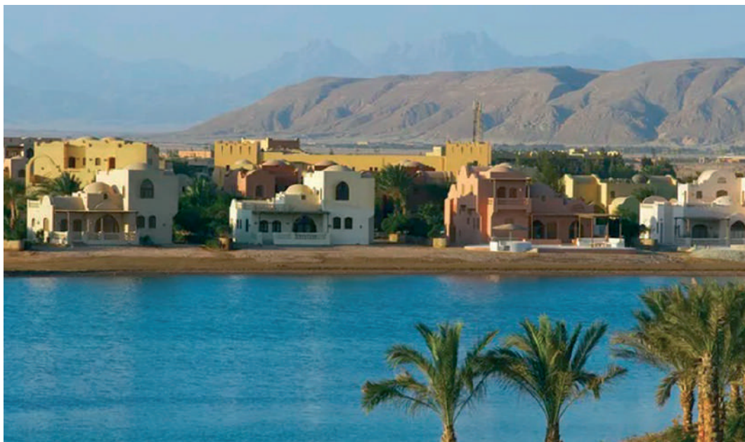
El Gouna egyiptomi üdülőhelység a Vörös-tenger északnyugati partján

Mózes, majd Józsué vezette zsidó seregnek a kánaániták kiirtását is! 8