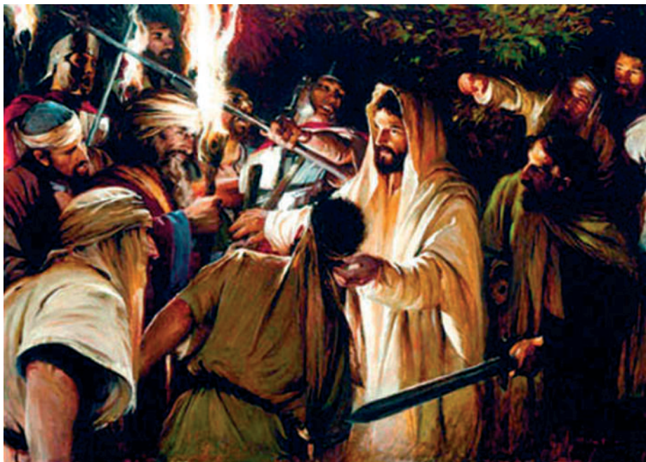
Jézus meggyógyítja a Péter által megsebzett Málkus fülét

Amikor annak idején e szavakat olvastam, mintha lepel hullott volna le a szememről: valóban, az Atya a mennyei sereget állíthatja mellénk, ha jónak látja, melynek egyetlen angyala is elég egy egész tábor legyőzéséhez! 5 Krisztus tanítványának ekképpen nem kell többé a saját védelmére gondolnia, hanem csak Urának, Isten Bárányának a követésére, aki alázatos volt és szelíd, 6 és arra tanított, hogy még az ellenségünket is szeretni kell (Máté 5:44).