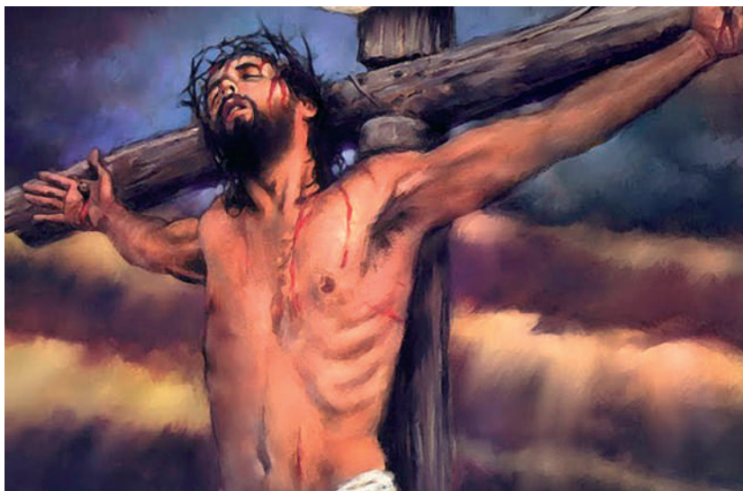
A mi Urunk, Jézus Krisztus a keresztfán

minden, gyorsabb vagy lassúbb formája, beleértve az egészségtelen szokásokat is, ugyanígy környezetünk esztelen kihasználása, fertőzése és rombolása, másrészt az abortusz, együtt a születendő gyermek egészségének megrontásával a terhesség alatti dohányzás, italozás és koffeinbevitel révén – e parancsolatba ütközik.