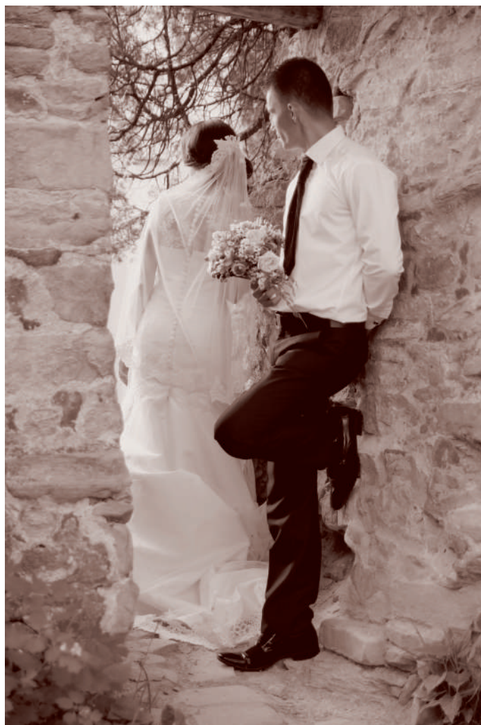
Minden házasságkötésnek azzal a gondolattal kellene indulnia, hogy egymást és majdani gyermekeinket a nemsokára eljövő örökéletre való felkészülésben kell segítenünk

szülei iránt – legyünk hát mi is azok megöregedett felmenőinkkel szemben. Szoktunk-e figyelni arra, hogyan reagálunk idősödő szüleink (ha még életben vannak, természetesen) néha gyermekies kéréseire? Tudatosítsuk magunkban, hogy a saját szüleinkkel való beszélgetési modorunkkal egyfajta mintát adunk a saját gyermekeinknek: nézd, fiam, így kell beszélni a szüleiddel, illetve így kell