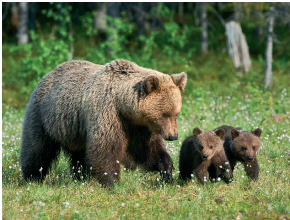
Anyamedve két bocsával a finn tajgán

hadseregével. Az Úr ekkor jónak látta azt, hogy az üldöző seregre visszaeressze a tenger vizét, teljesen megsemmisítve azt. 15