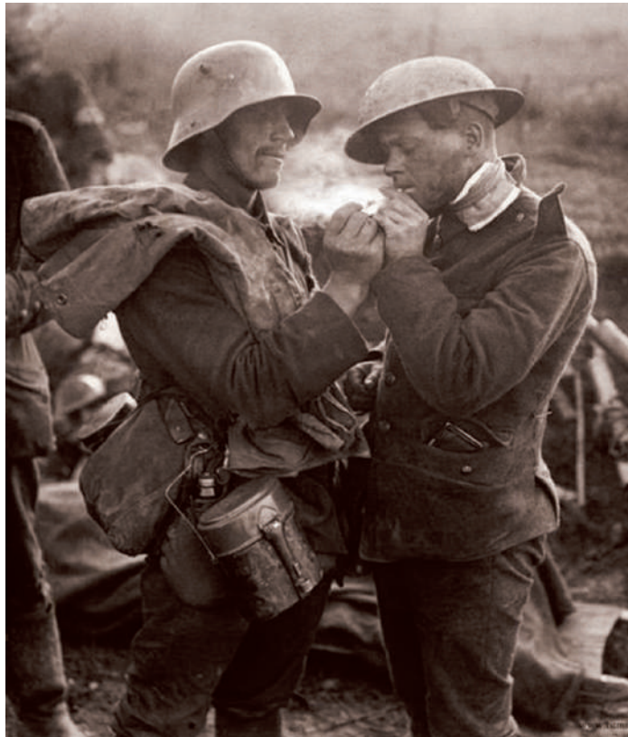
Pihenő az első világháborús fronton

vágás, biciklizés, autóvezetés, és megannyi más dolog. Csakhogy az