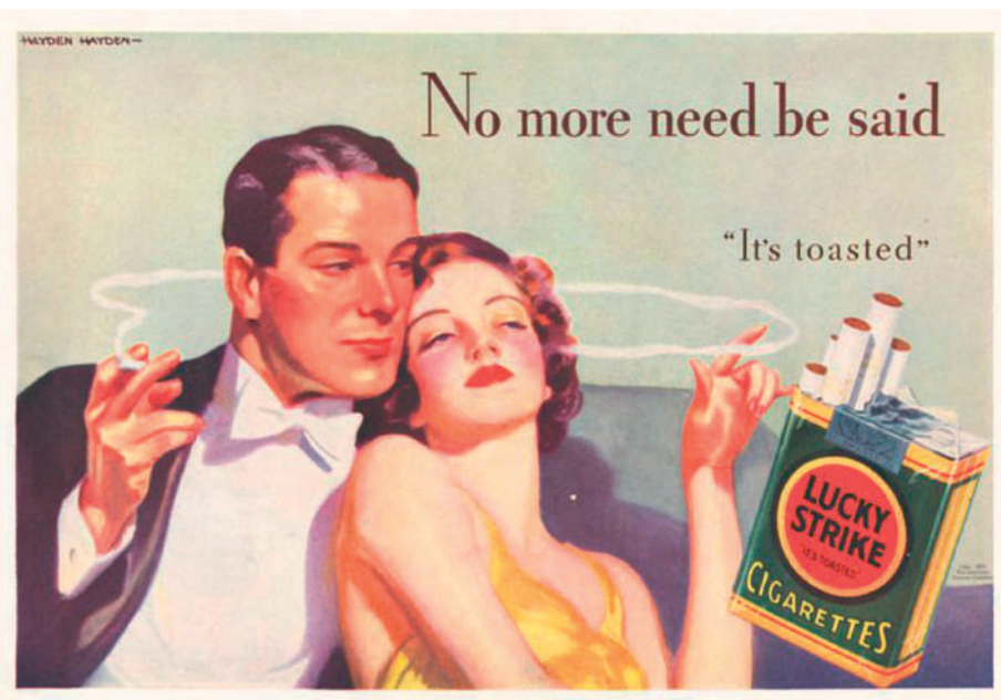
Két világháború közötti cigarettareklám

Ismerek egy másik nyelvből származó közmondást, amely így szól: „Ne próbáld lebontani az ember viskóját, amíg fel nem ajánlottál helyette egy palotát.” Azaz, van, aki semmi jobbat nem ismer, emiatt görcsösen ragaszkodik ahhoz, amilye van. A tékozló fiúnak, amikor a disznókhoz jutott, legalább volt mire visszaemlékeznie: az atyai ház nyugalma, bőségére... De ha nekem még