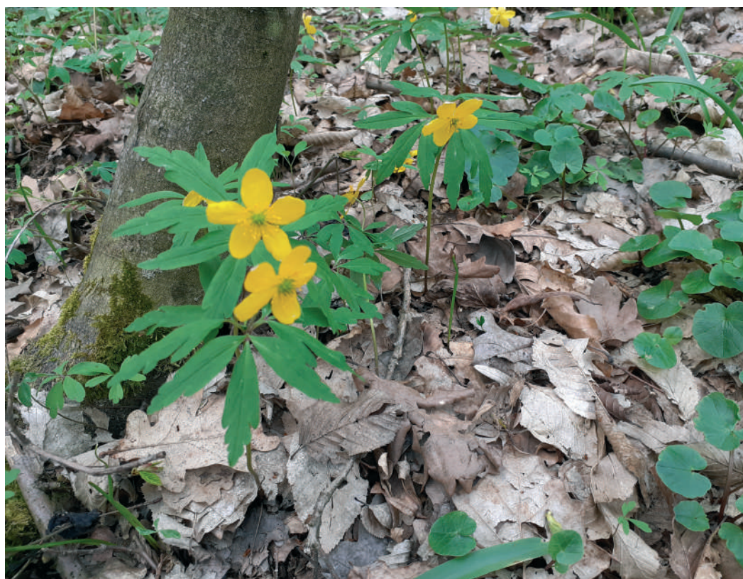
A tavasz hírnökei (Bogláros szellőrózsa)

Az Ige azonban mást mond. Mind az Ószövetségben Ábrahámot, mind az Újszövetségben hallgatóit az Úr arra szólítja fel, hogy legyenek tökéletesek. Isten nem kérne tőlünk valamit, ha tudná, hogy az lehetetlen. Ő tökéletességet vár el tőlünk emberi mivoltunkban, úgy, ahogy