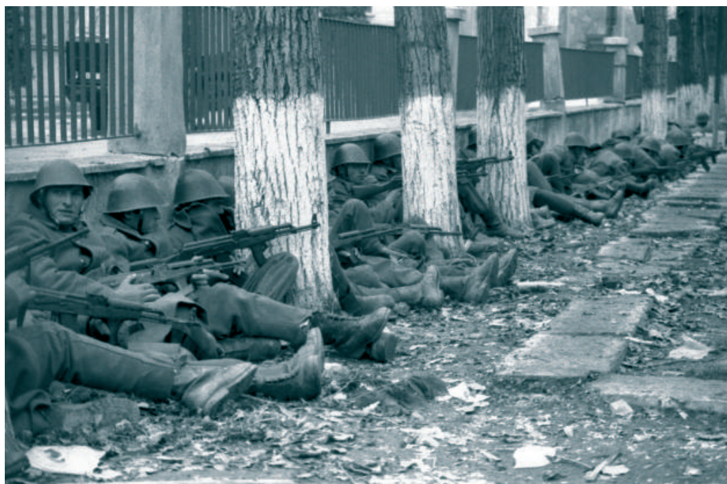
Román katonák 1989 december 23-án

Azóta is sokszor elcsodálkozom egyes hívő emberek naivságán, akik, amikor még kötelező volt a sorkatonaság, fegyvert fogtak, letették