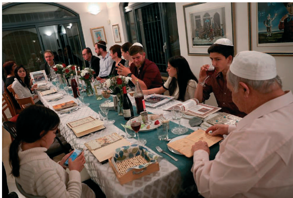
Zsidó család a Pészach (Pászka) ünnepén

den zár, balra nyílik, jobbra zár” – , a közösségi életben – pl. a déli harangszó – ugyanígy a helyi szokások, étkezés, udvariaság, köszönés, öltözködés terén. Mindezek rendkívül hasznosak lehetnek, és életünk megkönnyítését, helyes lefolyását szolgálják. Ekképpen, ha a Tízparancsolat tíz szabályt jelentene, bárki,