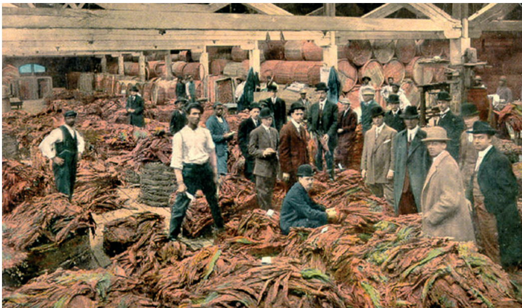
Richmondi dohányraktár, XIX. század, Egyesült Államok

Mindez a legvilágosabban az első világháború harcterein látszott meg. A szanitécoknak azt tanácsolták, tegyenek ci-