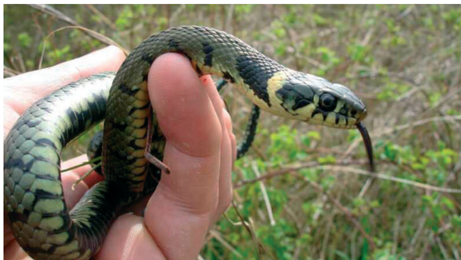
Fiatal vízisikló. Ezen lény emberre ártalmatlan, főleg békákkal, víziállatokkal táplálkozik

A kígyónak nincs mimikája. Mozdulatlan maradt, S szeme engem nézett Végig, míg ily értelmetlenül Utolérte a végzet.