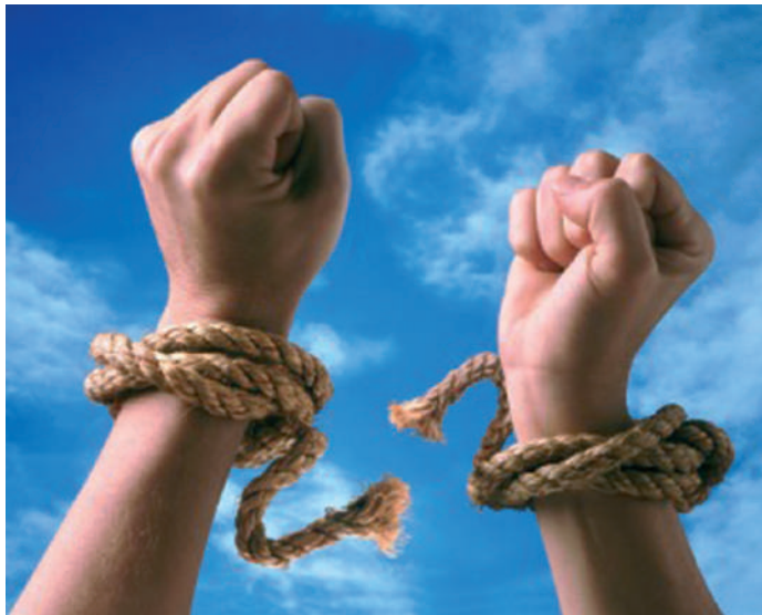
A valódi szabadulás csak Istentől jöhet

Ám Isten kegyelméből, '89 augusztusában találkoztam azazal a megvetett, kicsúfolt, vagy