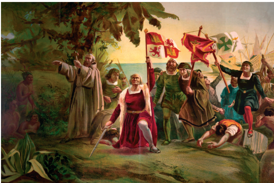
Kolumbusz Kristóf partra száll. Dióscoro Puebla Tolín (1831–1901) spanyol festő műve

Jött ám a második is. A dohányfüst, rágott bagó, szippantott burnót (azaz finom porrá őrölt dohány) mindig meghozta a maga eredményeit: beteges állapot, korai öregedés, csúnyulás, betegségeket magukban hordozó újszülöttek, a különböző ráktípusok, valamint szív- és érrendszeri betegségek, no meg az állandó pénzkidobás magára a termékre, meg az ezt kísérő kávéra, alkoholra, végül pedig a gyógyszerekre, operációkra. Az államnak meg a szociális kasszának végül is sokkal többbe kerül a számos beteg