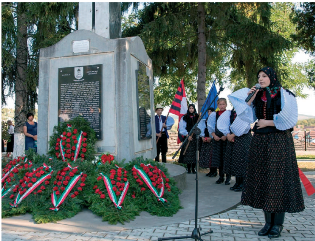
Bertalan-napi ünnepség az emlékműnél

A tatárok, megfelelő ellenállás híján, és az erős városokkal nem törődve Székelyföldet, a Szamos mentét, és az Alföld egy részét pusztították – falvakat, majorokat, bányavárosokat. Ekkor történt az, hogy augusztus 24-én a Doboka vármegyei Székre is rátörték. Néhány napi vérengzést, pusztítást követően elindultak hazafelé, ám a sok ezer, rabláncra vert fogollyal csak lassan haladtak. Csakhogy közben változott a helyzet. A köznép nem állt a lázadást szító kurucok oldalára, mivel azok a dúló tatárokkal együtt jöttek. A kurucok pedig nem mertek, és nem is tudtak volna beleszólni