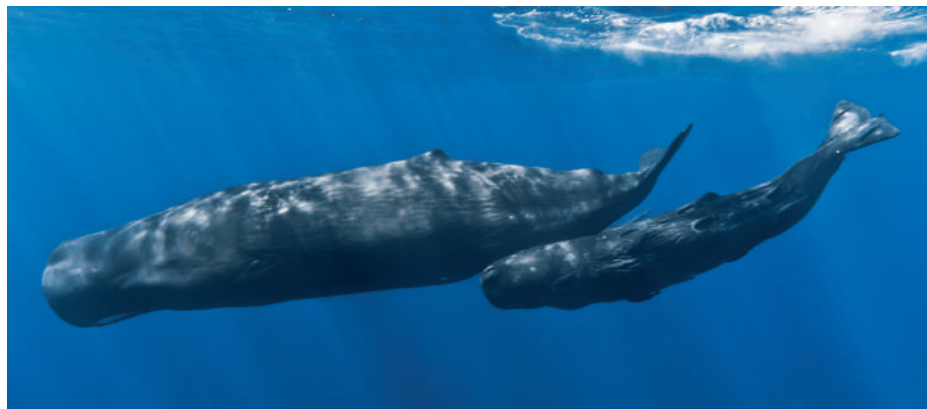
Ámbrás cet-anyja borjával az Indiai-óceánban, Mauritius szigete mellett

Egy régi ország fővárosa volt. A várost 13 kilométer hosszú kőfal vette körül, Akkora, mint egy mai nagyon nagy falu, körbekerítve. Parkokat, hatalmas épületeket, palotákat zárt körül.