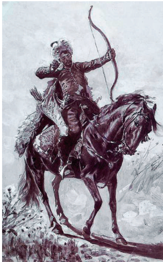
Krími tatár lovas

Amint már említettük, 1717 augusztusában krími és nogaj 3 tatárok serege tört rá a falura. Az egyik domb mögött rejtőzködő tatárok a templomba begyűlt, védtelen emberekre támadtak, majd a falut kirabolták és felgyújtották. Szokásuk szerint esztelenül mészároltak, majd több száz embert hurcoltak magukkal, hogy a Krímbe visszatérve, a török birodalom rabszolgapiacain eladják, vagy esetleg váltságdíj fejében visszaadják őket. Az ezutáni harcok, a további mészárlások, és a közben kitört pestisjárvány miatt a több száz elhurcolt ember kisebb része menekült meg.