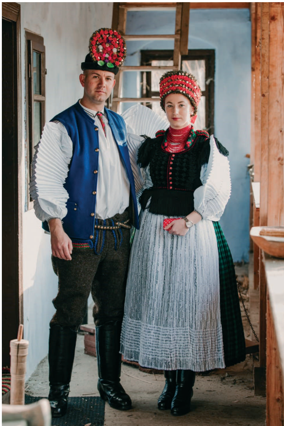
Széki fiatal pár helyi viseletben

pusztított, felégetett községet a kormányzat mezőségekkel és székelyekkel telepítette be, kiegészítve a meggyérült lakosságot. A támadás napja, az augusztus 24-i Szent Bertalan nap azóta is a falu legfontosabb emlékünnepe.