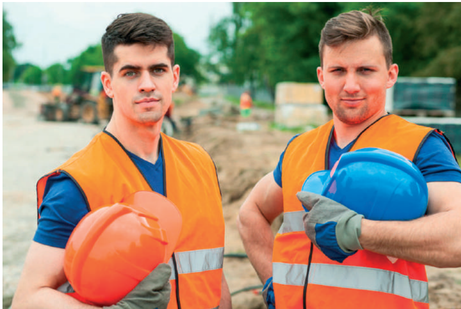
Krisztus szemüvegén keresztül teljesen másképp fogjuk látni embertársainkat, szeretetben eltűrve hibáikat, gyengeségeiket

A három férfi összenézett. E jóleső szünet után rosszkedvük teljesen elszállt, és óvatosan meg