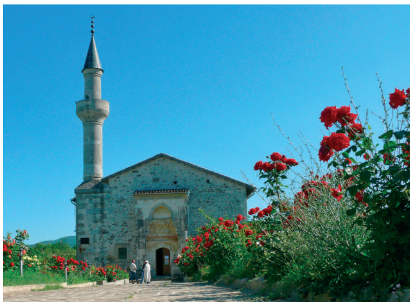
A Krím-félsziget egyik legrégebbi mecsete, az Űzbég Kán Mecset

a Radnai-hágón), Mihai Racoviță moldvai fejedelem katonáival, s néhány száz kurucral együtt.