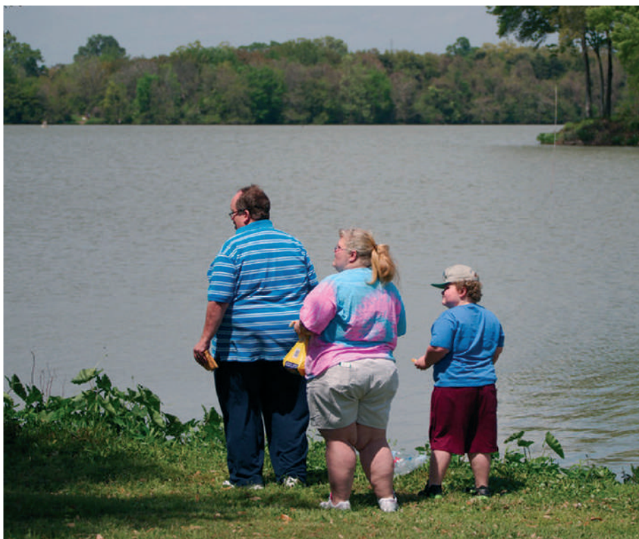
A modern, túlzott kalóriabevittel társuló ülő életforma átka az egyre terjedő elhízottság

A túlsúly, de elsősorban az elhízás okaként az örökletes tényező hozható fel, ami azt jelenti, hogy egy családon belül halmozottan fordulhat elő. De a nagyon elhízott személyeknek is csak mintegy egynegyede okolhatja öröklött génjeit. Vannak olyanok, akik bár magukban hordozzák az örökletes tényezőt, mégsem