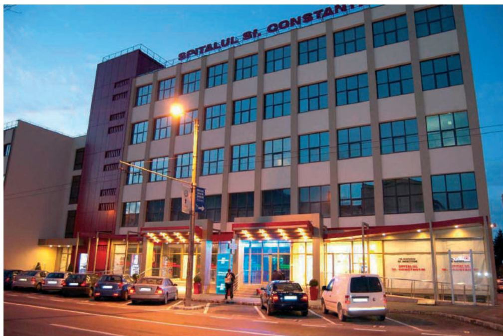
A brassói Szent Konstantin klinika

éjjel álmomban szólott hozzám, ezt mondva: „Ne félj! Mire a számlát rendezned kell, meglesz.”