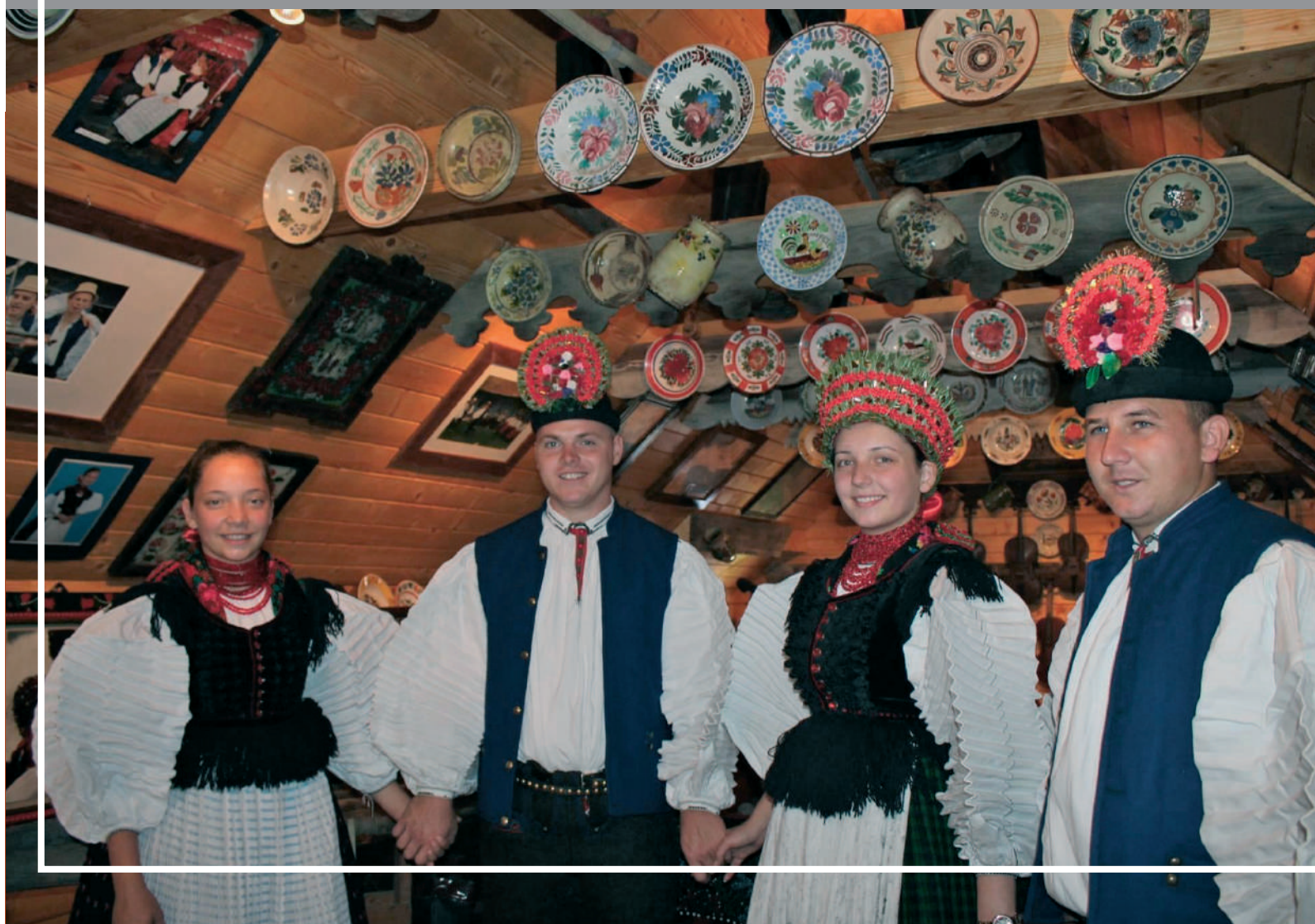
SZÉKI FIATALOK HELYI VISELETBEN

1002-ben említi dokumentum. Városi jogokat 1291-ben, III. Endre királytól nyert, melyeket Mátyás király 1471-ben megerősített. Désaknával, Kolozsal és Tordával együtt a Kolozsvár környéki fontos erdélyi sóbányához tartozott. A sóbányászat 1812-ig folyt, amikor is a bányákat bezárták jövedelmezőségük csökkenése miatt. Ekkortól az amúgy is szikes talajú, nehezen művelhető földekkel rendelkező székiek élete nehezebbé vált,