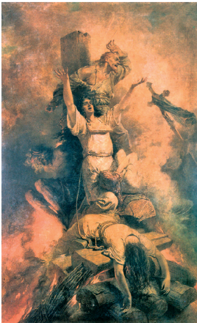
Zichy Mihály (1827–1906): Auto-da-fé (Actus fidei – Hitcselekedet, vagy Hitítélet) – az Inkvizíció halálos ítéletének végrehajtása

és azok reájuk rontva, megszűntessék a még megmaradt szabadságukat és jogaikat. Tehát, a hazug és embergyilkos Sátán meg az ő jobbkeze, Kajafás, a zsidó