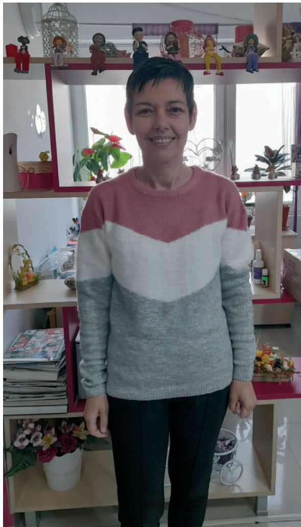
A műtétek után

A történet folytatódik, és csak most jön a java. A kolozsvári onkológián orvostól orvosra jár-