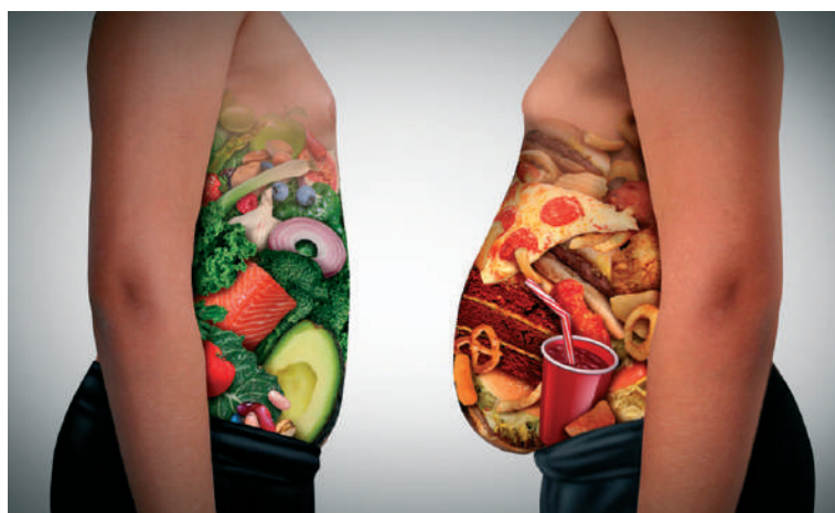
Ha táplálkozásunk alapját nem a zsíros, állati eredetű és finomított, hanem inkább a természetes állapotú, növényi élelmek képezik, a hasi elhízás esélye nagyon lecsökken

endokrin szerv , melynek szerepe van a szénhidrát- és zsírszövetekben. A hasüregben belül, a zsigerekben (belső szervek) felhalmozódó zsírszövet, kóros (gyulladást