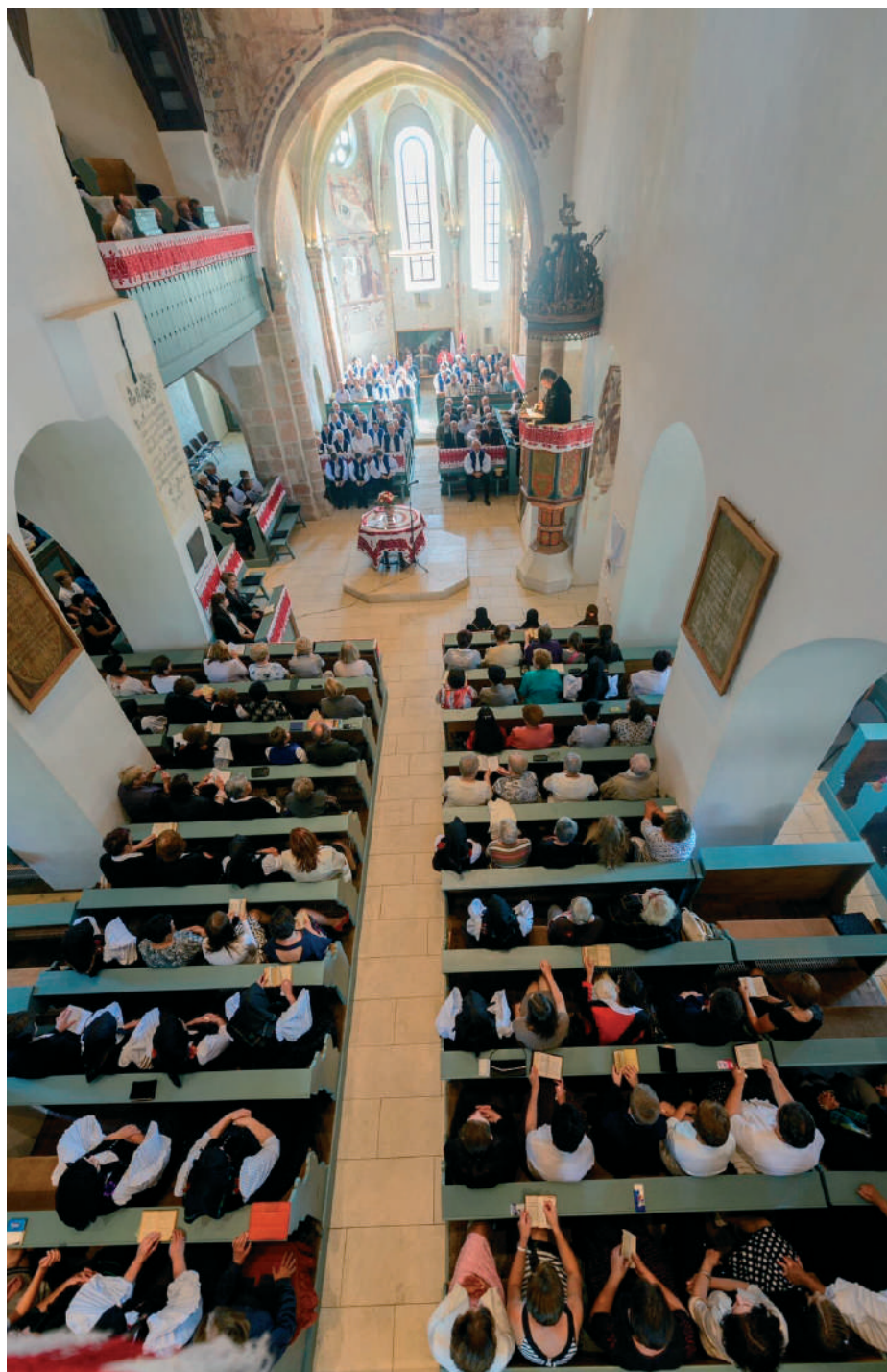
A széki református gyülekezet

kieket. Mind Erdélyben, mind Magyarországon elismertek szorgalmuk, megbízhatóságuk, és tisztaságuk miatt. A hatvanas évektől kezdve a férfiak a szocialista korszak építkezéseinél vállaltak nagy szerepet, majd a rendszerváltás után Magyarországon kezdtek el dolgozni – a népművészeti termékek eladása mellett a férfiak újra csak az építkezésben,