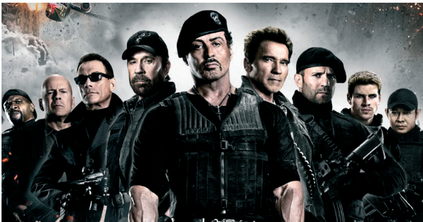
A hollywoodi akciófilmek hőseinek nyelvezete és viselkedése erőteljes hatást gyakorol a nézők beszédére és gondolkodására