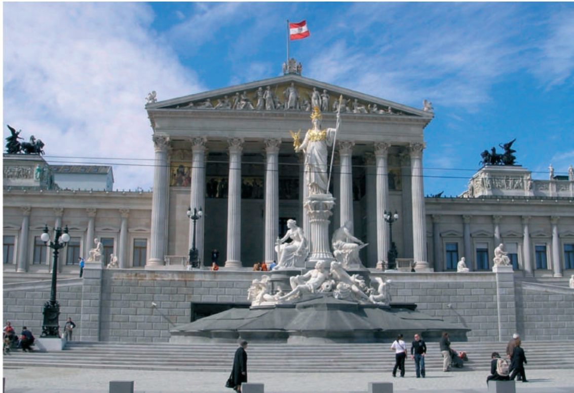
Az osztrák Parlament épülete, Bécs

Ceuşescu fény-korszakának megszorításai is ugyanígy országunk és népünk javát, és dicső, sokoldalú fejlődését kívánták előmozdítani. Ezért vették el a villanyt telenként délután fél öttől éjfélig, és fűtötték fel (jó esetben) csupán tizenkét fokra a tömbházlakásunkat – nem beszélve az üres élelmiszerüzletekről, az üzemanyag és mindenféle áru hiányáról. Ami a villanyt illeti: akkoriban az országunk fogyasztásának csupán három százaléka volt a lakossági – a többi a sok esetben rosszul működő, energiát pazarló ipar használta el. Tehát, a mi három százalékunkból akart