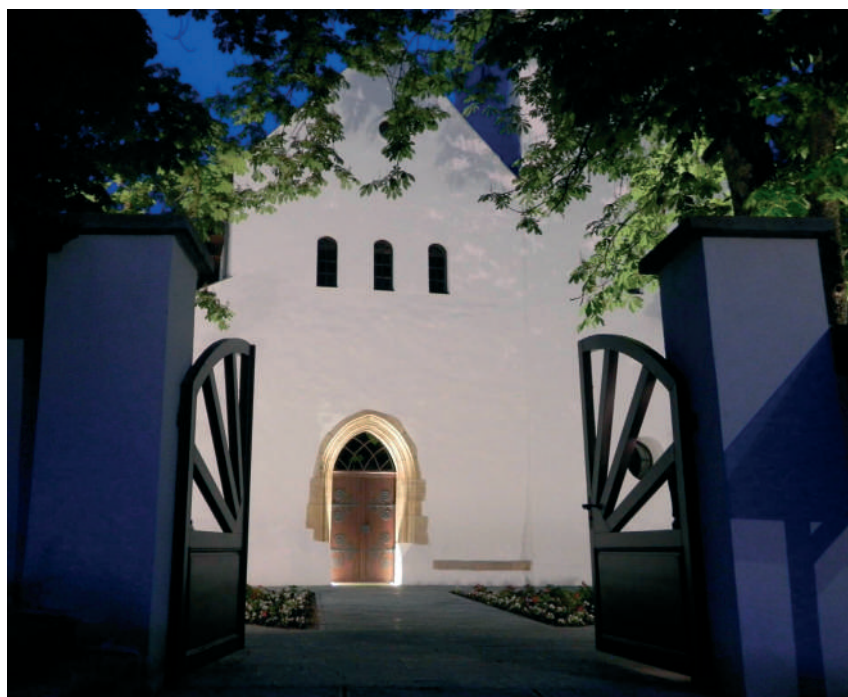
A dicsőség Királya alig várja, hogy velünk együtt bevonulhasson a menny örökkévaló kapuin. A széki református templom bejárata

Ha igen, akkor ne tartsunk meg semmit magunknak, hanem engedjük át teljesen életünk irá-