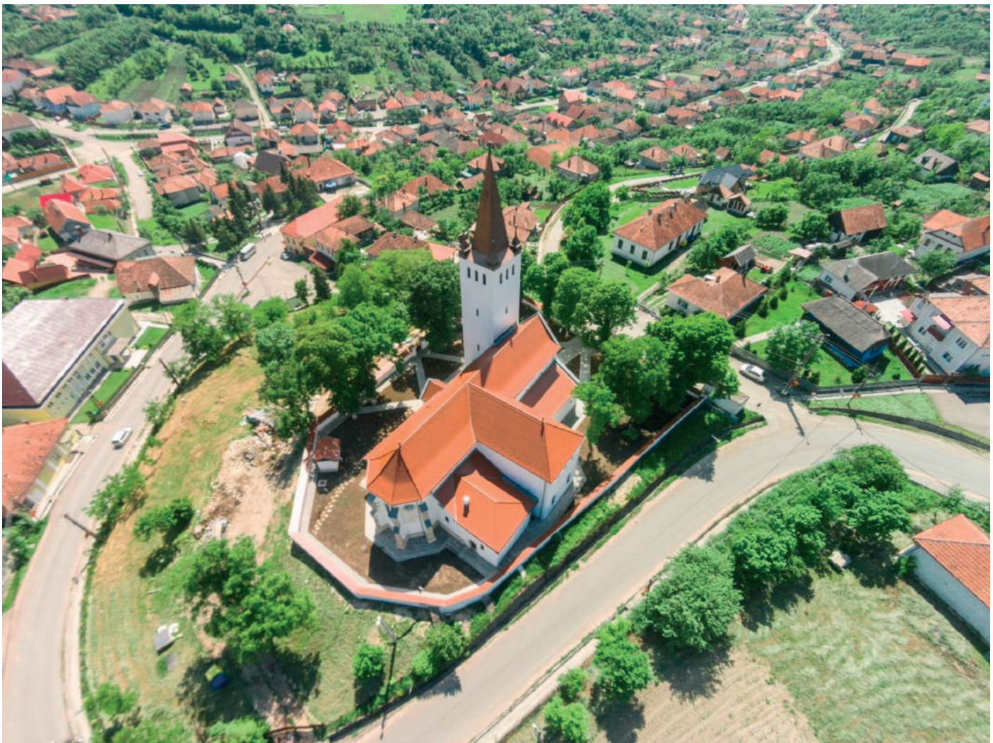
A református templom

A nehéz életkörülmények és a szegénység megedzette a szé-