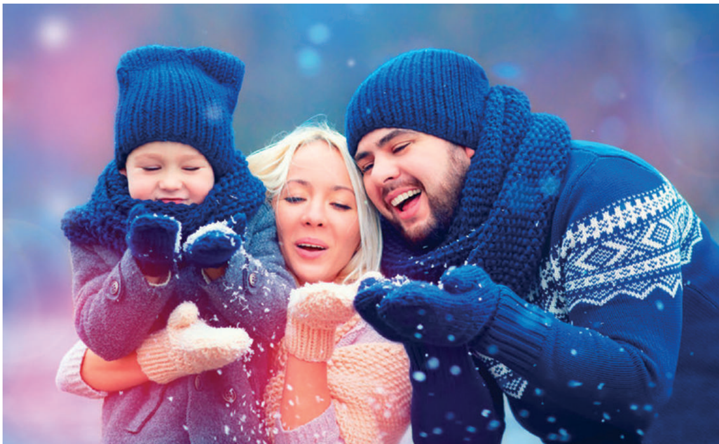
A szerető család a legszebb fennmaradt, édenkerti ajándék

Isten úgy döntött, hogy a kezdetben tökéletes emberpárnak – a menny angyalaihoz hasonlóan