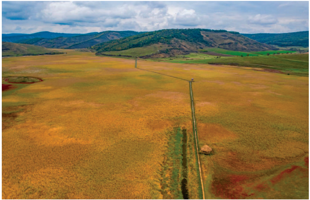
A széki Nádas

Ha Széken járunk, miután meglátogattuk az ősi református templomot, pihenjünk meg egy kissé a mellette levő padokon: messze ellátni innen több irányba, a Mezőség hullámos tengerén. Vigyük fel imában Isten elé e község lakosait, s ugyanígy családjainkat, és egész népünket: az Úr segítsen meg csak reá tekintve élni, szeretetben, Őbenne bízva, várva az Ő szent Fiának közeli visszatérését, és az örök életet.