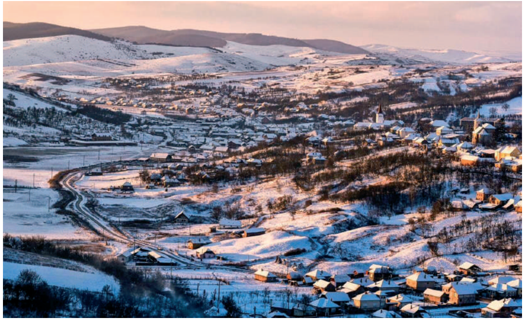
Szék és környéke

Városunk látványossága volt e szokás. 1 A széki népviselet, és annak színei, a Bertalan-nap gyászát megörökítő fekete és piros, a széki táncok ma is – a XXI. században jól benne járva – élnek. A zene tipikusan mezősi. Széken minden falurésznek – szegnek – megvoltak a házai, ahová táncolni jártak. Maga a népzene kultúrában oly ismert táncház szó is innen ered. Sajnos, talán a székely vér miatt is, a mulatságok sokszor adtak