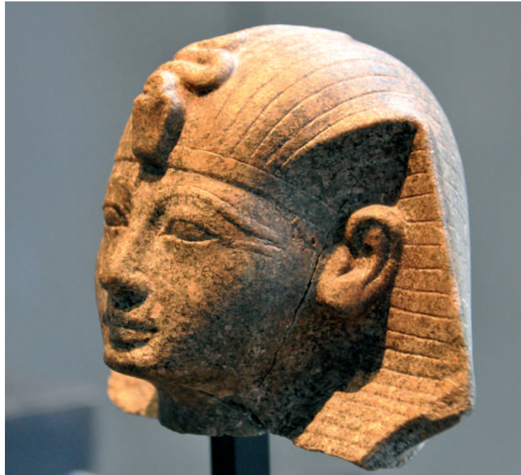
II. Amenhotep szobrának fejrésze (Egyiptomi Művészet Múzeuma, München)

Kedves Olvasók! Sátánról, a mi életünk, boldogságunk és üdvös-